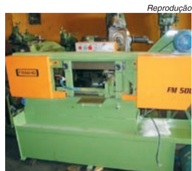
Serra franho semelhante a do acidente

de falta de proteção e de sensor já havia causado um acidente em janeiro, atingindo um dedo de outro trabalhador.