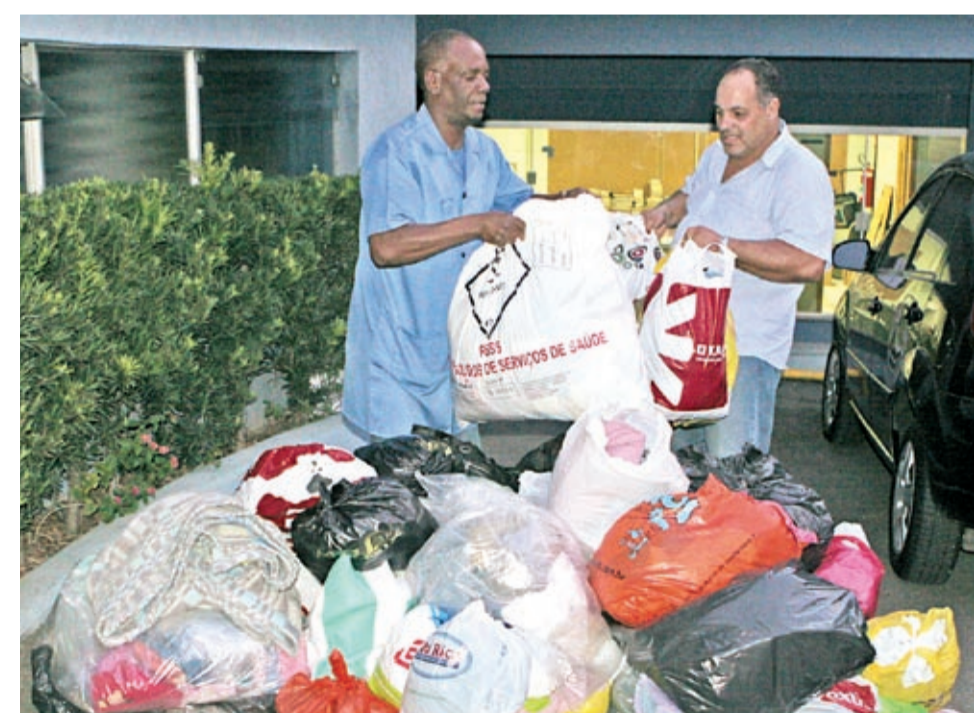
Fumaça, do CSE, entrega doação feita pelos trabalhadores na Kostal

Uma sala no Centro Celso Daniel já está lotada de roupas doadas pelos metalúrgicos do ABC para os desabrigados pelas chuvas no Estado do Rio de Janeiro.