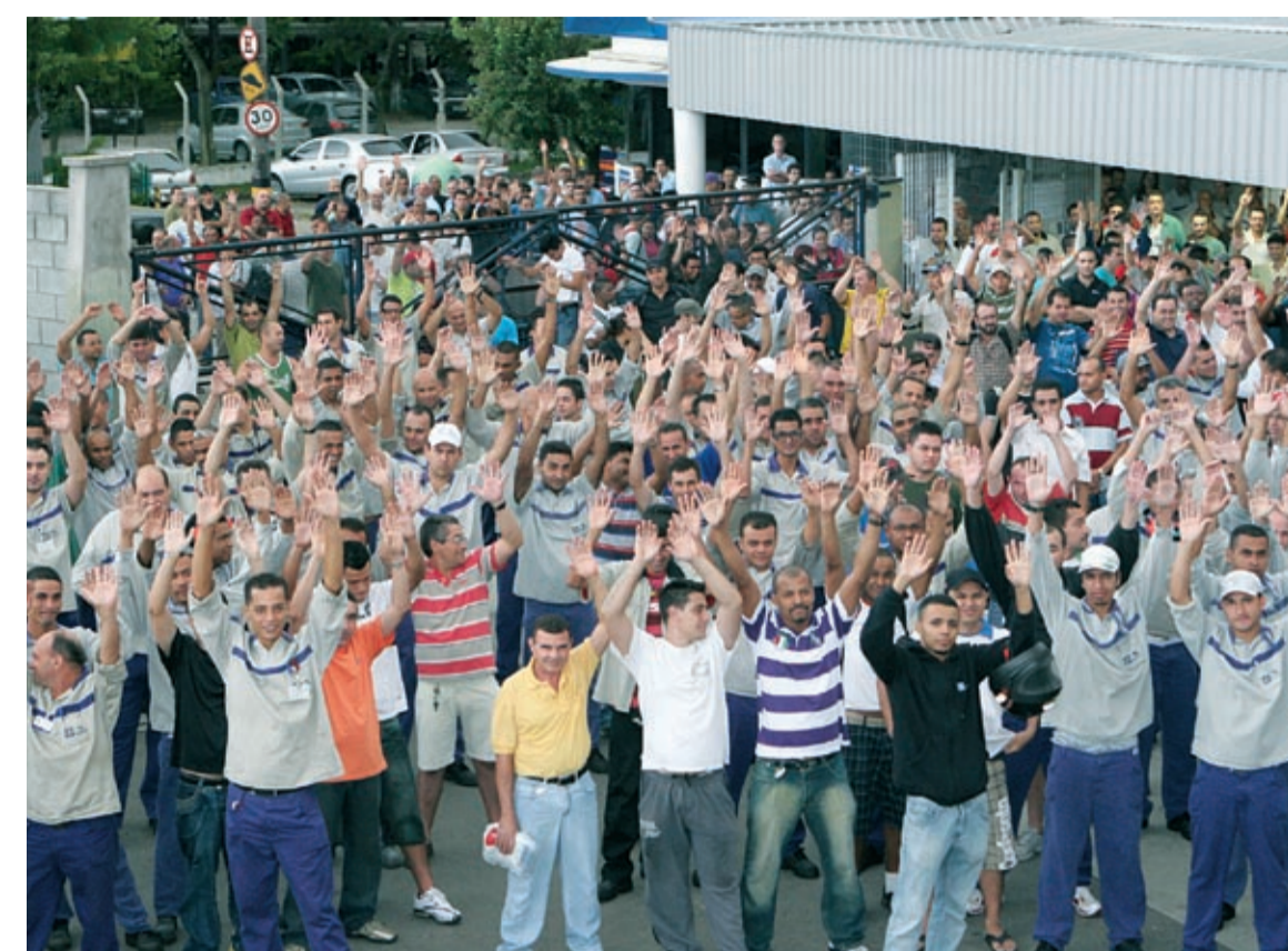
Trabalhadores aprovam PLR e vão continuar unidos por outras reivindicações

Agora que foi superada a luta por um bom acordo