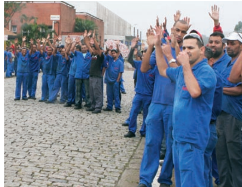
Trabalhadores na luta por melhores condições de trabalho

Entre os diversos assuntos que serão apresentados para a discussão com os patrões estão a volta do convênio com a farmácia, a