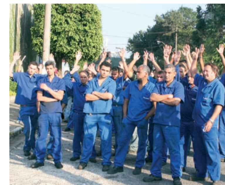
Na Selmec, força ao CSE garantiu a proposta