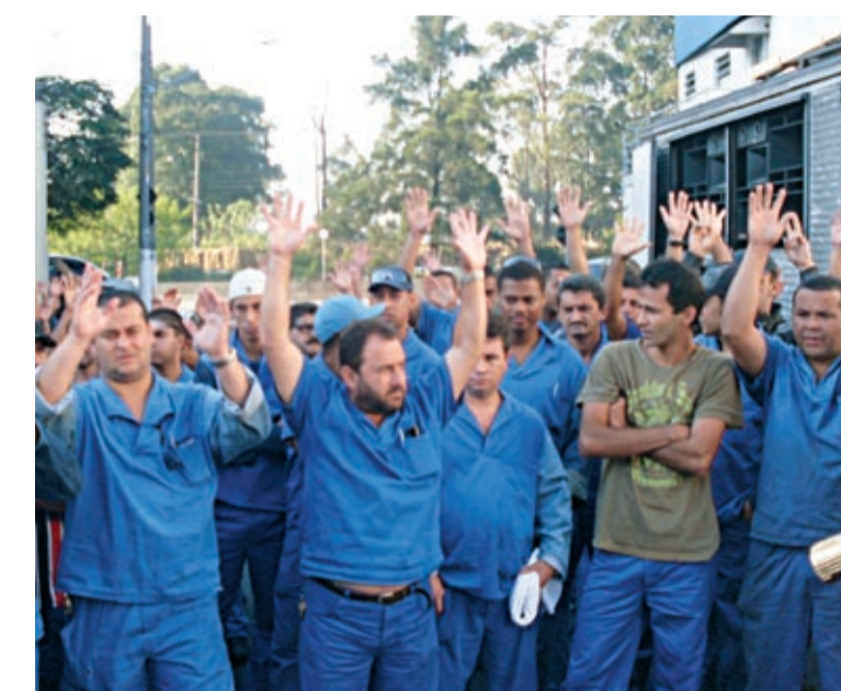
Depois de uma semana de mobilização, conquista na IGP

A primeira parcela da PLR será paga em julho deste ano e a segunda em março de 2011.