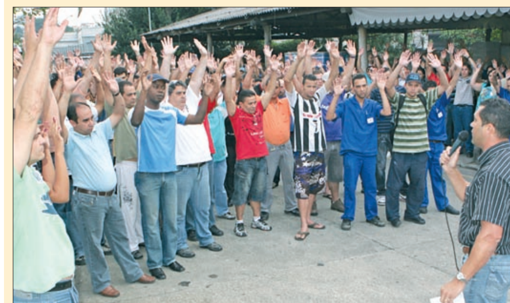
Trabalhadores na Affinia aprovam proposta que garante PLR melhor que a do ano passado

Luta aumenta PLR na Affinia, IGP e Selmec