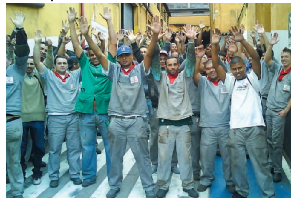
Um dos acordos foi fechado pelos companheiros na Mastermag

Trabalhadores entregaram aviso de greve dando 48 horas de prazo para empresa em Ribeirão Pires responder.