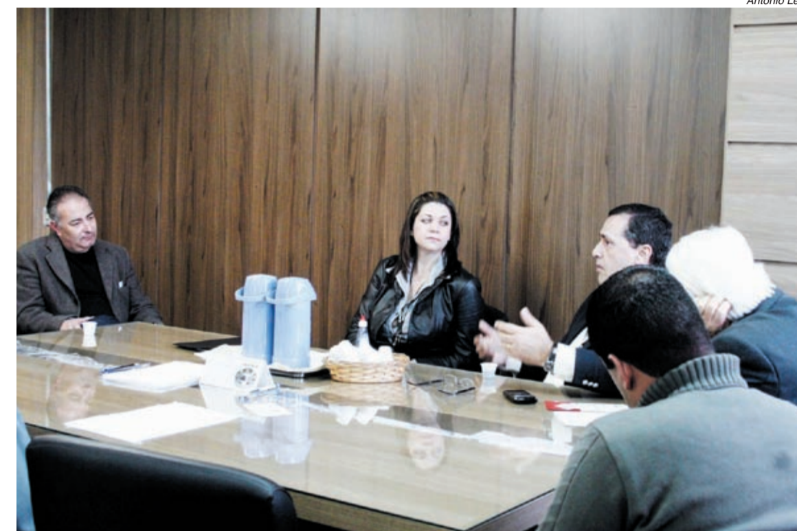
O presidente do Sindicato recebe representantes da Continental para assinatura de acordo

A companheirada vai aguardar até 48 horas para que as negociações sejam retomadas.