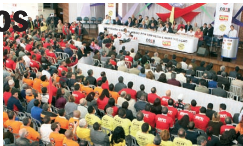
Trabalhadores têm direitos de se reunir e participar dos rumos do País, como no ato de 10 de abril

Segundo ele, a ação dos tucanos é mais um lance das elites políticas para a criminalização dos movimentos sociais e sindicais. “Política se discute no campo das idéias e não perante o Poder Judiciário”, comentou Sérgio Nobre.