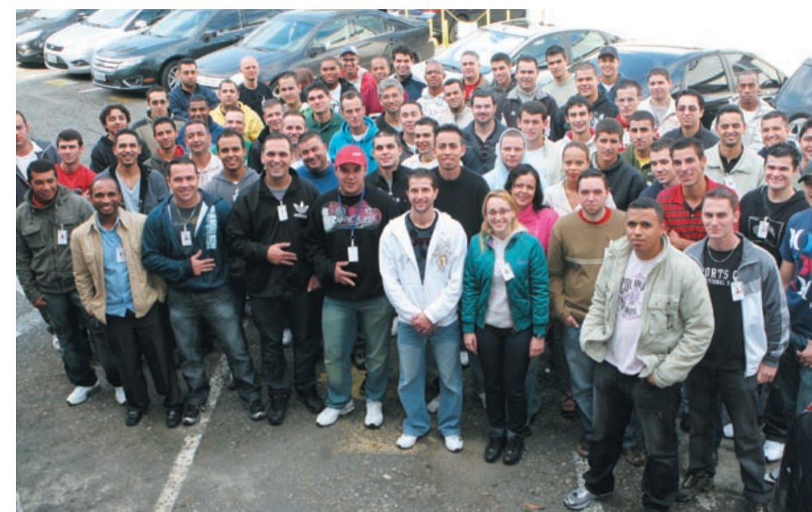
Primeira turma dos 200 novos contratados fez treinamento e integração

Os organizadores do movimento e das manifestações estimam que 800 mil pessoas foram às ruas. Pesquisas mostram que a maioria dos franceses se opõe à reforma.