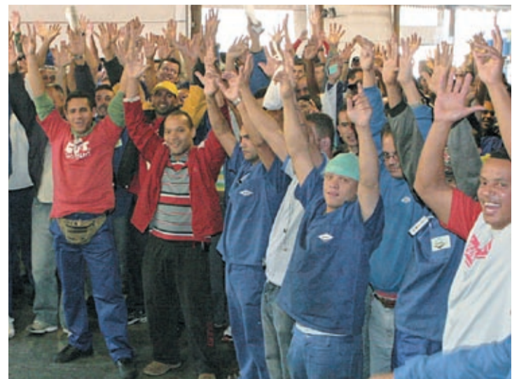
No Grupo Dana, valor da PLR teve uma boa recuperação