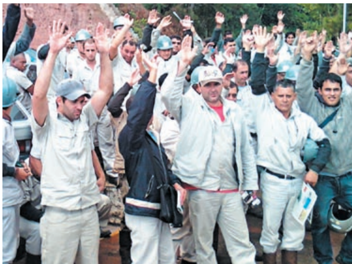
Proposta na Arcelor saiu depois da greve dos trabalhadores