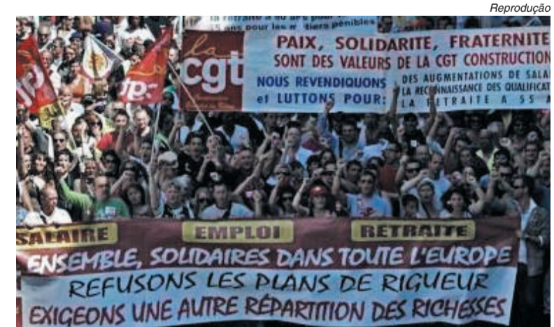
Trabalhadores saem às ruas para não pagar a conta da crise

Ela lembra que o serviço anterior era limitado, sem perspectiva. “Saí sem arrependimento”, analisa.