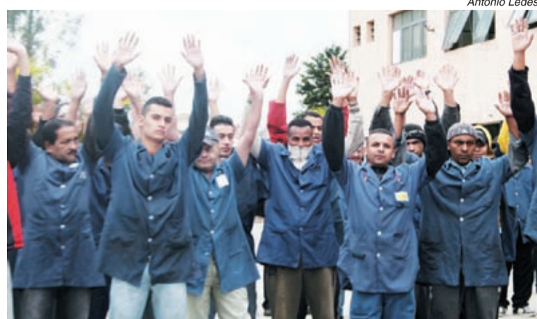
Na Eurocron, trabalhadores aprovam aviso de greve