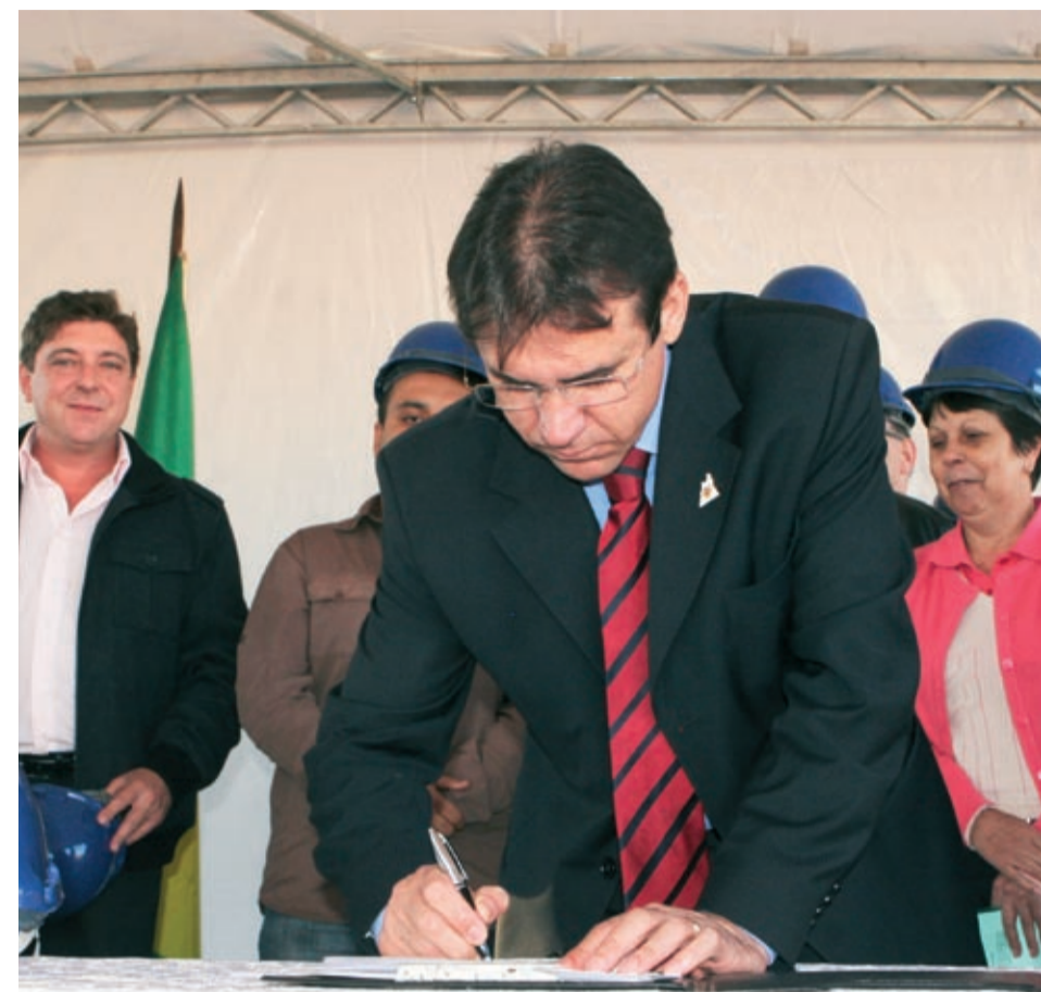
Para o prefeito, Trabalho Decente é fator de desenvolvimento para a cidade