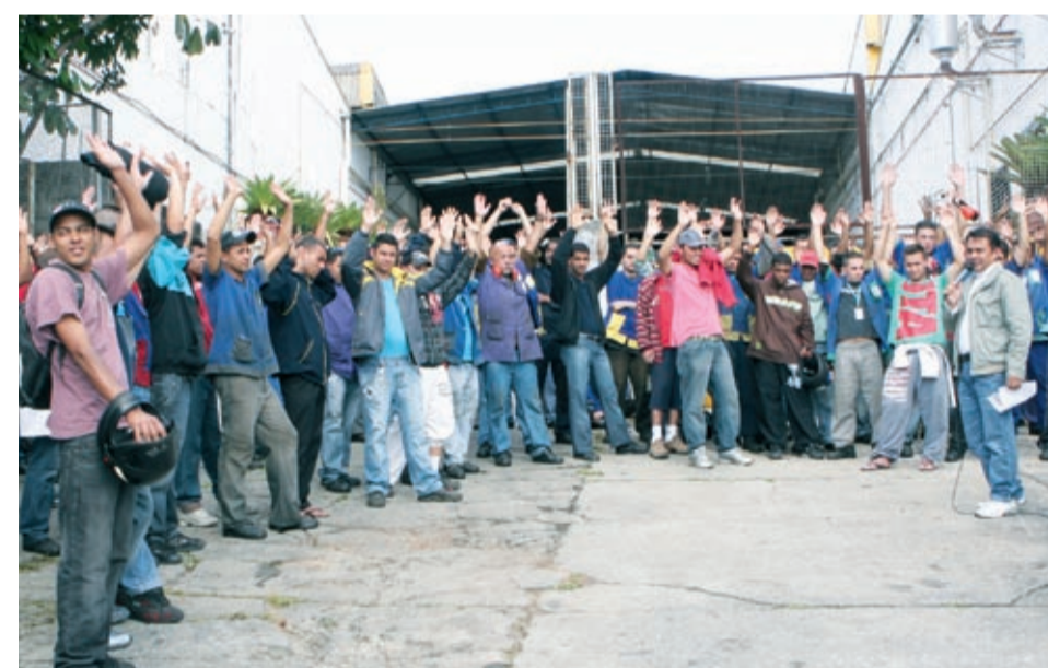
Proposta aprovada na Continental tem bom reajuste

Propostas foram aprovadas na VMG, em Ribeirão Pires, na Poliron e na Continental, em Diadema. Protestos prosseguem na Mahle, em São Bernardo.