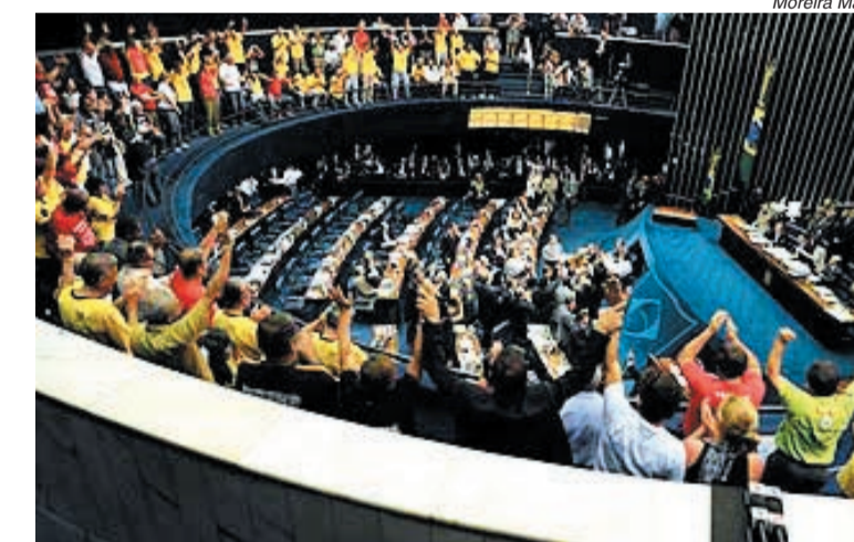
Aposentados comemoram na galeria o reajuste aprovado

De acordo com técnicos do Congresso, o fim do fator significará despesas anuais extras de R$ 4 bilhões. O governo federal defende uma negociação com as centrais para por fim ao fator.