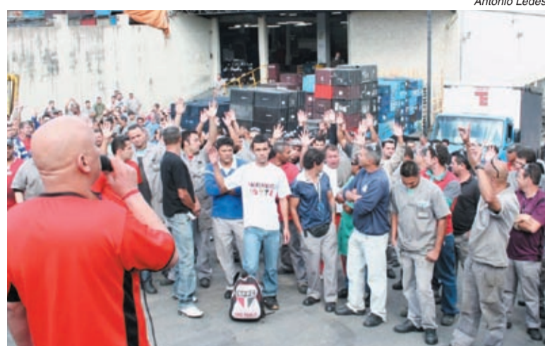
Rejeição da proposta aconteceu em assembleia ontem à tarde

Outra bronca é com as condições de trabalho e à