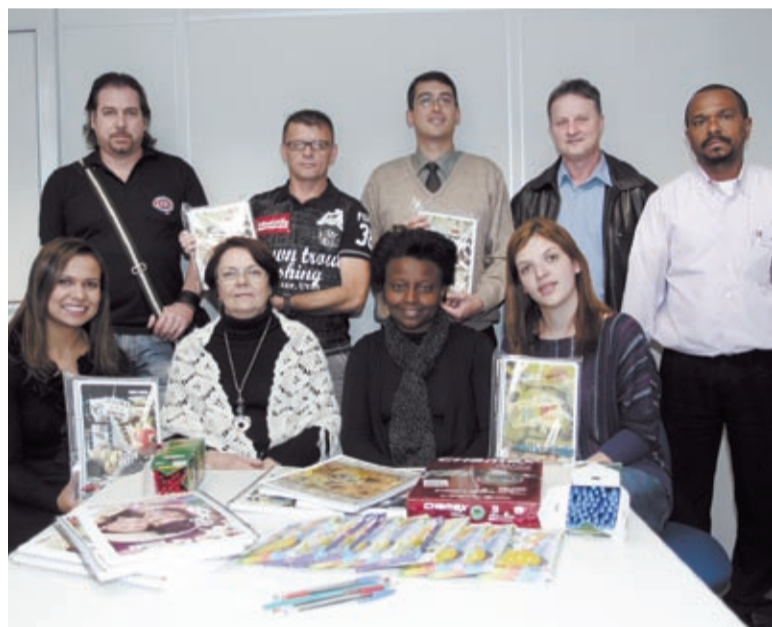
Momento da entrega da doação do material escolar

O aprendizado dos alunos do Movimento de Alfabetização de Jovens e Adultos do ABC – MOVA, recebeu quatro mil itens de material escolar doados pela Fundação Volkswagen.