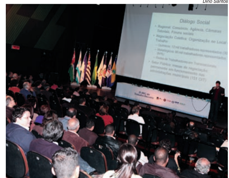
Conferência colocou o ABC como primeira região a debater o tema

"Além de procurar a formalização para todos os trabalhadores, o Comitê vai propor medidas que reduzam a diferença salarial entre homens e mulheres, o nível de desemprego entre