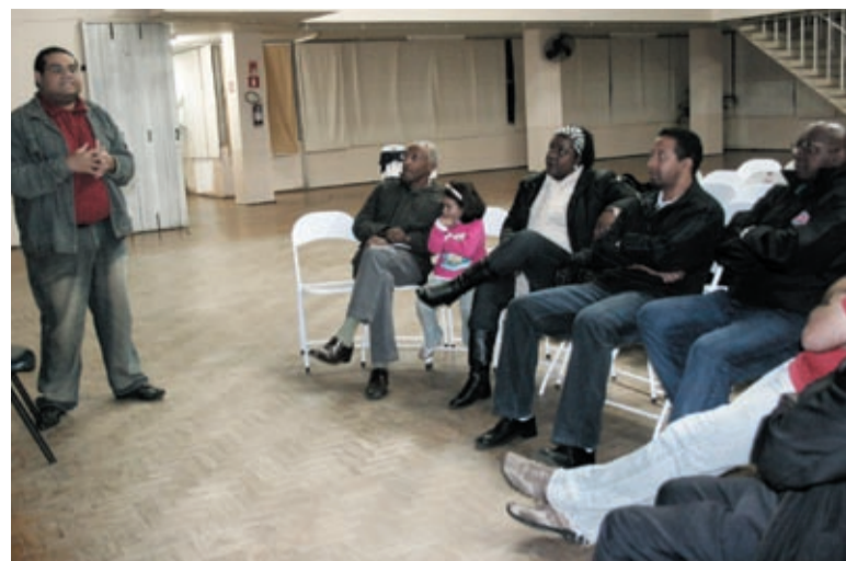
No Roda de Conversa, as políticas de igualdade racial desenvolvidas em São Bernardo

Ele comentou que o Estatuto, ao definir como políticas públicas a implementação de programas de ações afirmativas, abre espaço para o governo federal regulamentar as cotas por decreto.