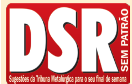
Sugestões da Tribuna Metalúrgica para o seu final de semana