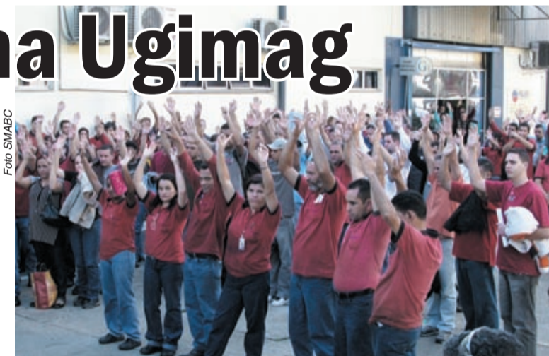
Acordo na Melling tem aumento em relação ao valor do ano passado

Os trabalhadores estão em alerta e esperam que a fábrica volte a negociar rapidamente e apresente uma proposta que atenda os anseios da companheirada.