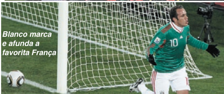
Blanco marca e afunda a favorita França

Titulares fizeram treino leve, e os reservas um coletivo contra o The Birds , time amador sub-19 do subúrbio de Johannesburgo.