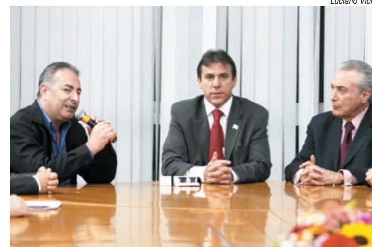
Sérgio, Marinho e Temer no gabinete do prefeito

Candidato a vice-presidente da República na chapa da petista Dilma Rousseff, o deputado saudou a participação dos metalúrgicos do ABC na luta pela redemocratização do País, ao justificar a homenagem da Câmara ao Sindicato em maio