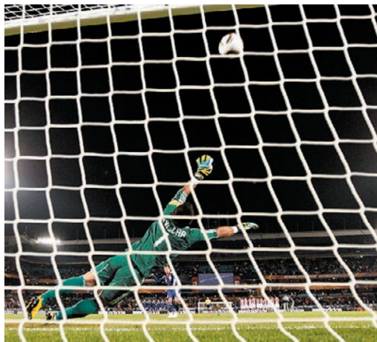
O japonês Komano perdeu penalti e o Paraguai se classificou