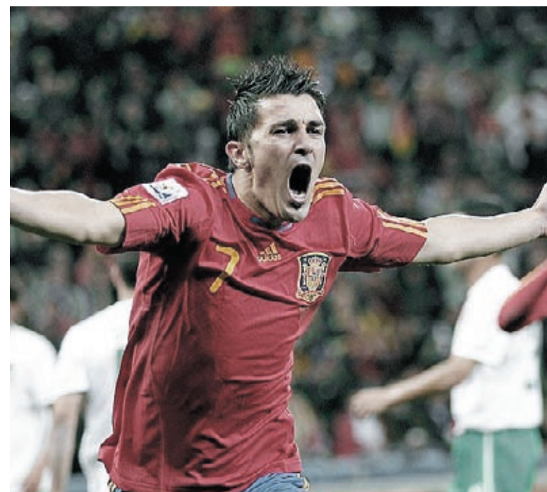
Villa marcou mais um e garantiu a Espanha nas quartas