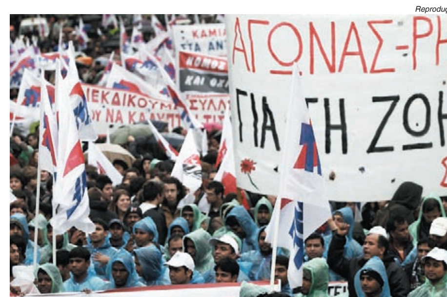
Milhares de gregos saíram ontem às ruas contra o pacote do governo

As lutas que os trabalhadores europeus fazem hoje é a mesma que fizemos nas décadas de 1980 e 1990 porque ambas são contra os mesmos inimigos: os banqueiros internacionais e o Fundo Monetário Internacional (FMI).