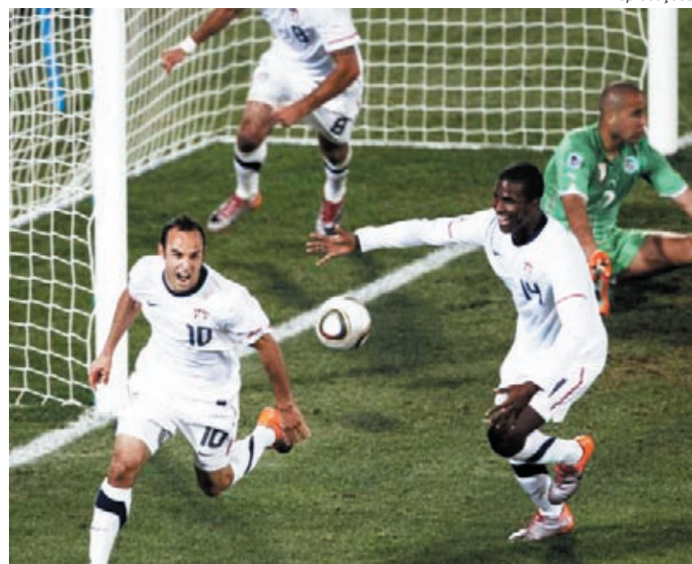
Donovan (10) marca e classifica a seleção americana