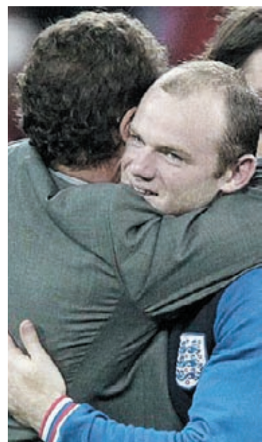
Rooney e Capello comemoram

Gana, único africano classificado, pega os Estados Unidos.