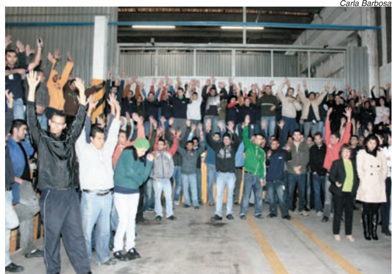
Trabalhadores não aceitaram as metas de absentismo na SMS

SMS - Já na SMS, fábrica de equipamentos para estabilização de energia em Diadema, a maioria dos companheiros rejeitou a proposta de PLR apresen-