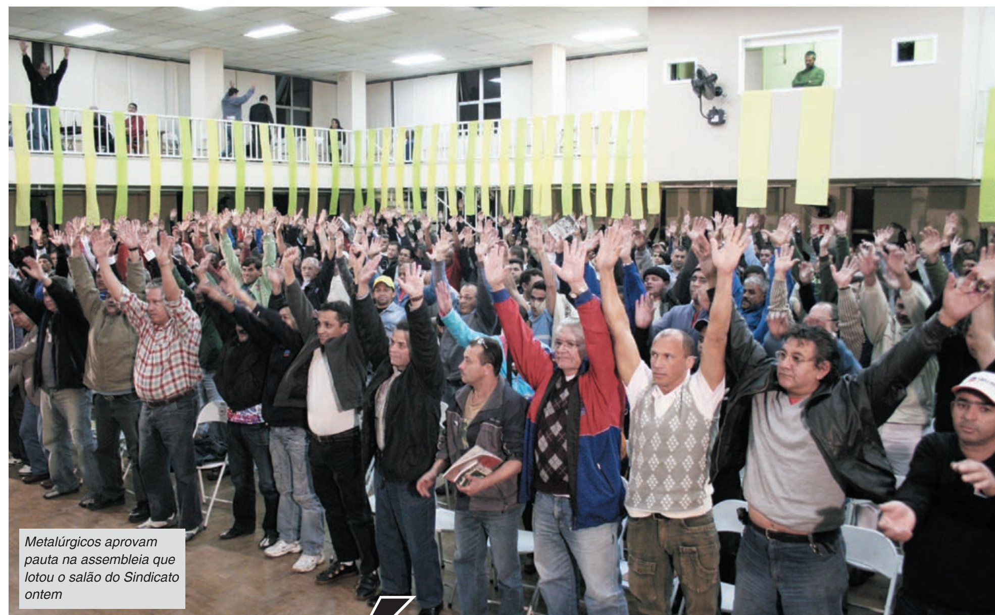
Metalúrgicos aprovam pauta na assembleia que lotou o salão do Sindicato ontem