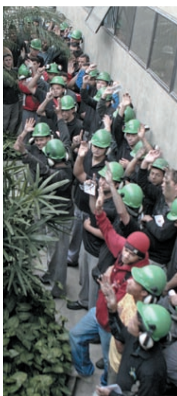
PLR melhor na Estrela

“Agora, vamos sentar com a empresa para discutir e resolver este problema. Só então marcaremos nova assembleia”, afirmou.