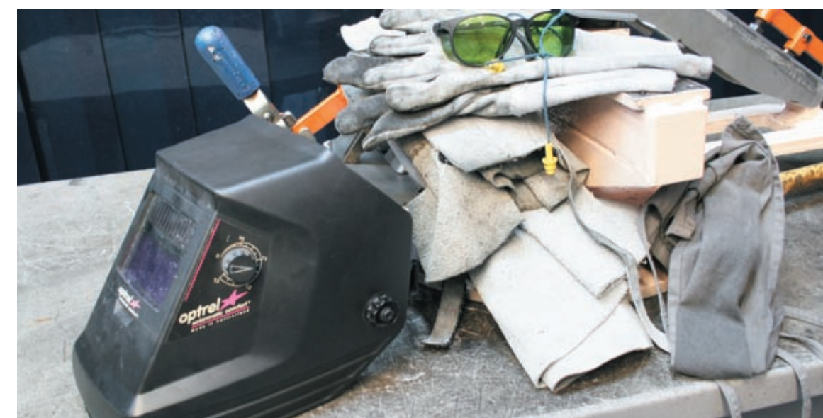
EPIs são objetos da luta diária dos cipeiros

Nas décadas de 70 e 80, a CIPA foi o caminho para que a militância pudesse iniciar um processo de organização sindical interna nas fábricas.