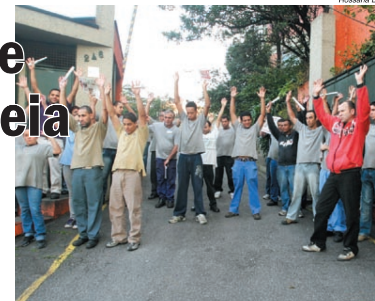
Companheiros na Incodiesel mobilizados por pauta de reivindicações

Incodiesel - Na assembleia que realizaram também na sexta-feira, os trabalhadores na Incodiesel avisaram que, se for preciso, vão realizar ações de pressão para terem um