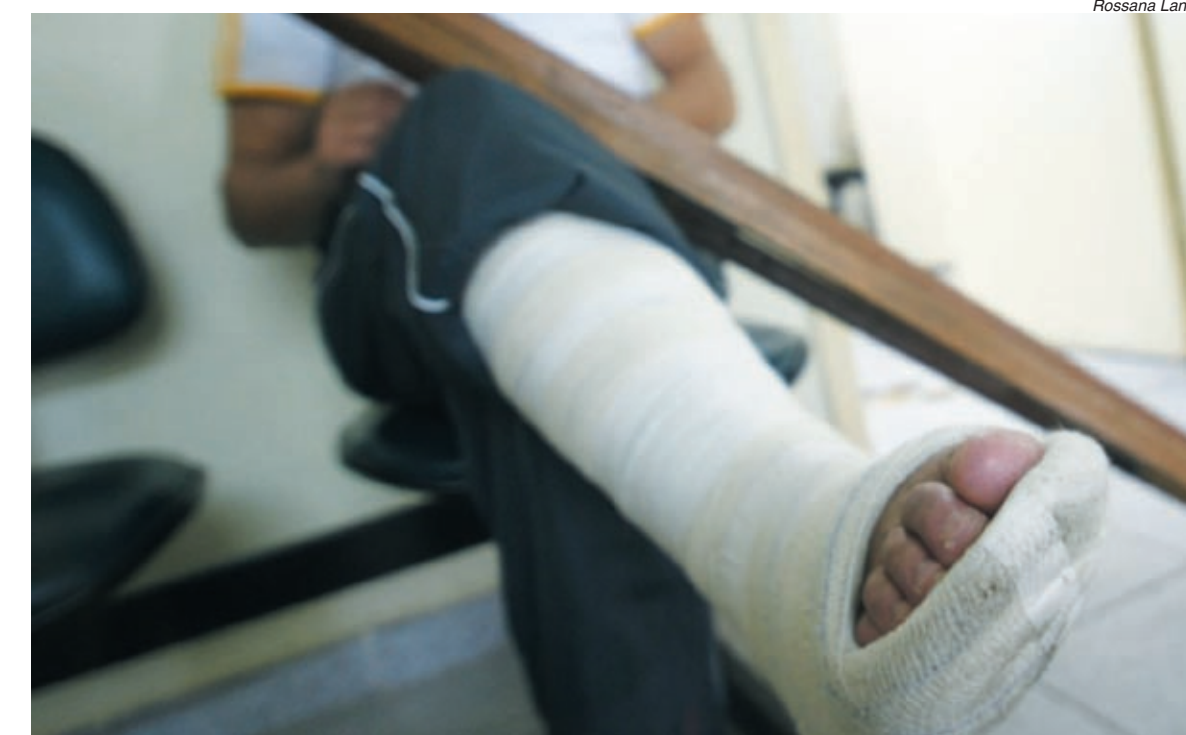
O INSS só poderá cortar os auxílios depois da realização da perícia médica

Agora, o benefício não será suspenso até que o segurado passe pela perícia agendada antes da data da alta programada. Essa resolução é baseada em decisão da Justiça e o INSS ainda não disse se vai recorrer. Enquanto isso a resolução é válida.