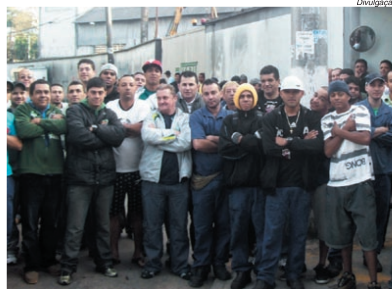
Trabalhadores na Evacon cruzam os braços para garantir direitos