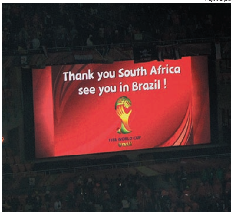
O telão do Soccer City convidou a todos para virem ao Brasil

bola. Na final, foram 57% de posse de bola espanhola, contra 43% dos holandeses.