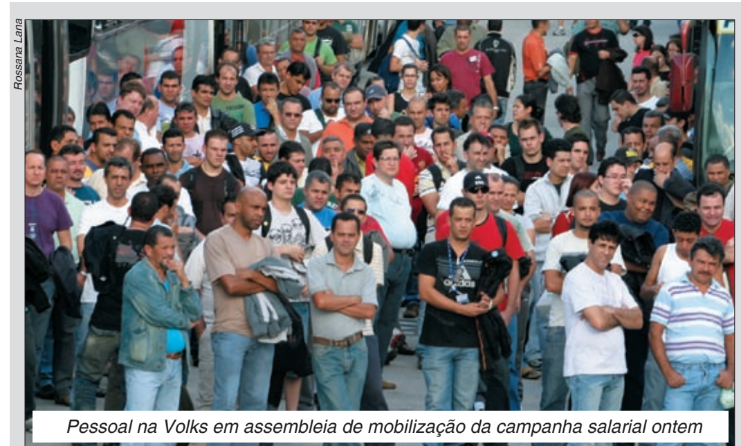
Pessoal na Volks em assembleia de mobilização da campanha salarial ontem