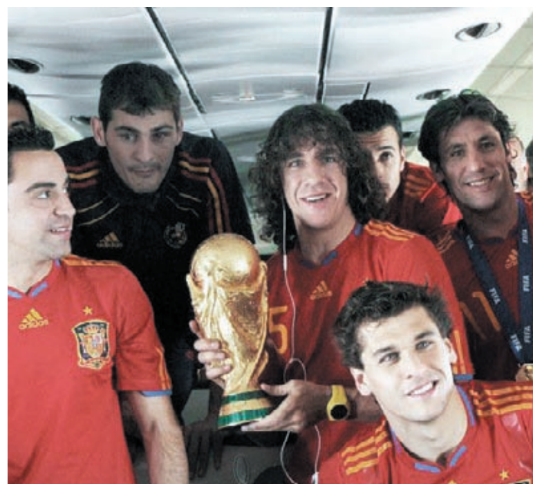
Muita festa no retorno para a Espanha

No mundo inteiro, mais de 3 bilhões de espectadores assistiram às parti-