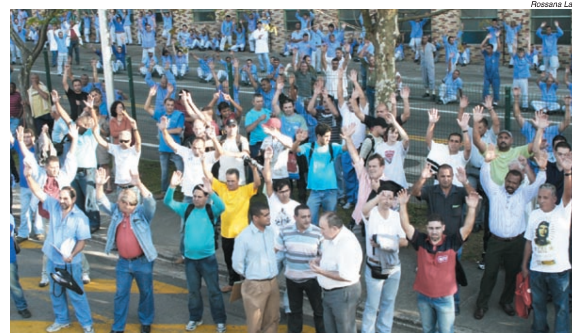
Assembleia de mobilização no pátio da Volks, em São Bernardo, ontem