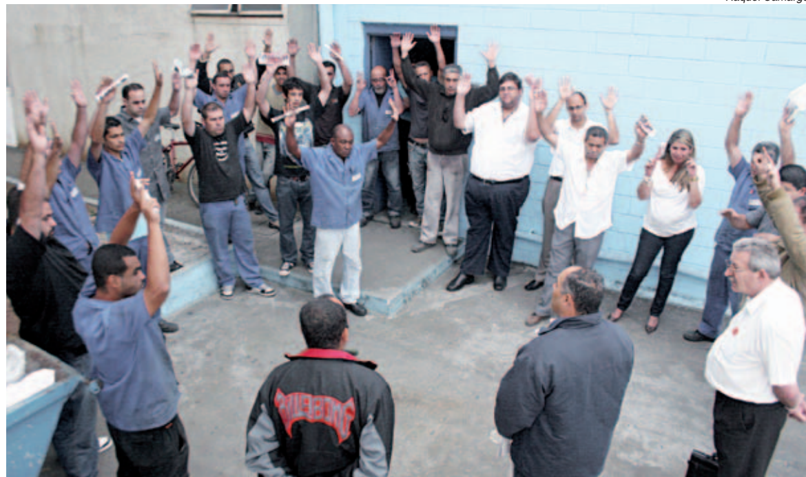
Para fazerem valer o direito, trabalhadores aprovaram aviso de greve

Depois que a empresa negou por três anos seguidos seus pedidos para negociar PLR, os trabalhadores na Serra Bucher, fábrica de automação em São Bernardo, compraram a briga.