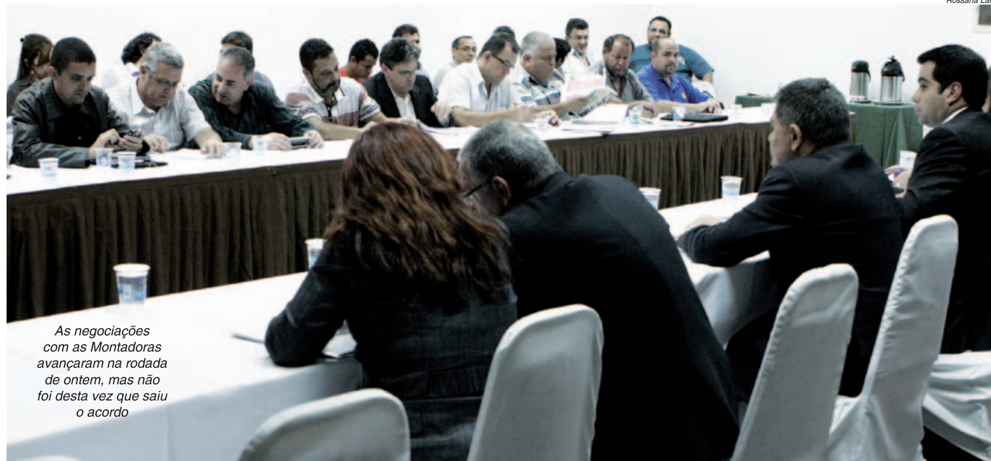
As negociações com as Montadoras avançaram na rodada de ontem, mas não foi desta vez que saiu o acordo