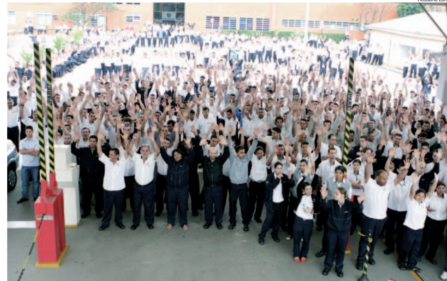
Ato ontem pela manhã na Scania serviu para mostrar a disposição de luta dos trabalhadores nas montadoras

“Será a última oportunidade das Montadoras mostrarem bom senso”, comentou.