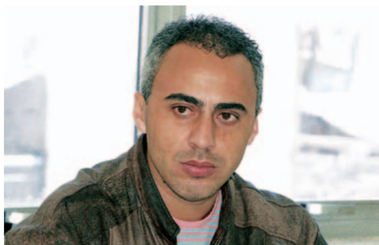
Krica disse que a nova entidade vai debater a revisão do plano diretor

O Conselho tem 36 integrantes, sendo 18 representantes da Prefeitura e 18 da sociedade (sindicatos, universidades, movimentos populares, empresários e ambientalistas).