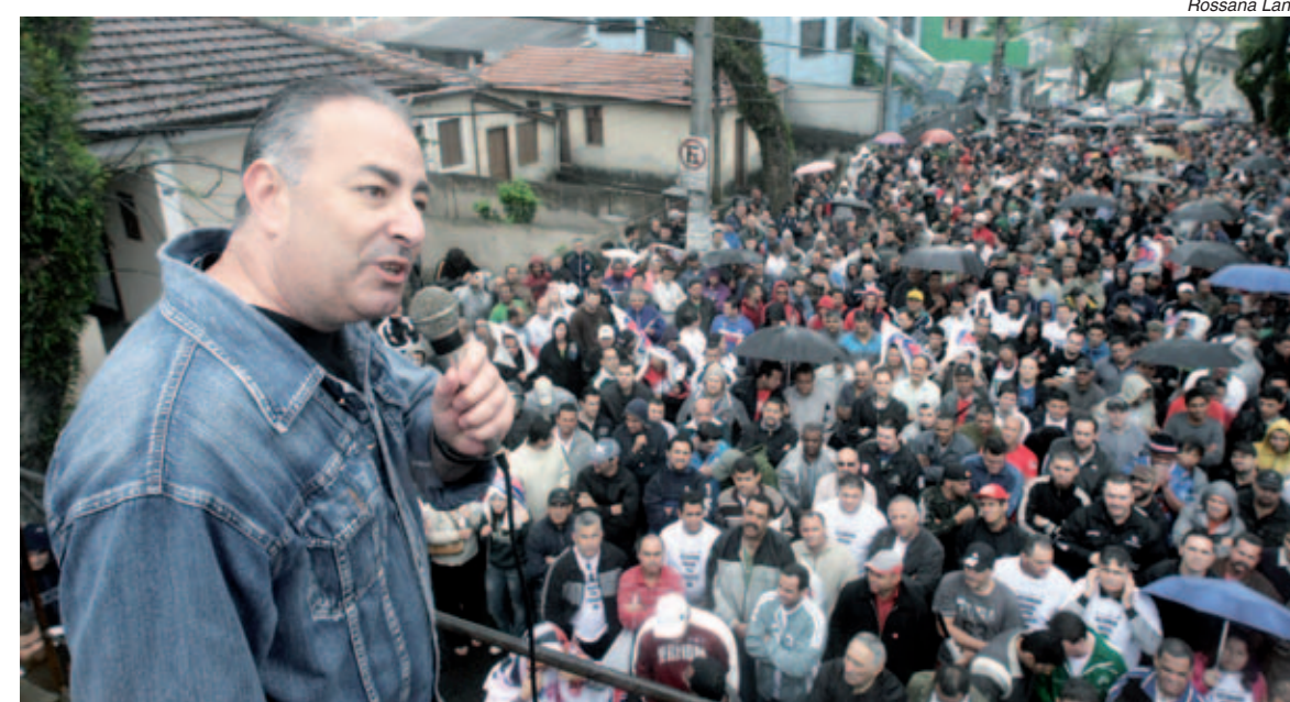
Assembleia autorizou Sindicato a fechar acordo caso a proposta fosse melhorada

ção Estadual dos Metalúrgicos (FEM) da CUT passaram o fim de semana negociando essa nova proposta com as montadoras até chegarem ao acordo.