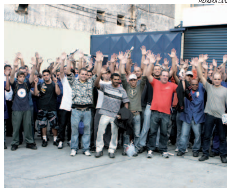
Readequação dos horários possibilitou conquista dos trabalhadores

“Conquistamos a redução porque a fábrica precisou readequar os horários dos turnos. Isso mostra que é possível trabalhar