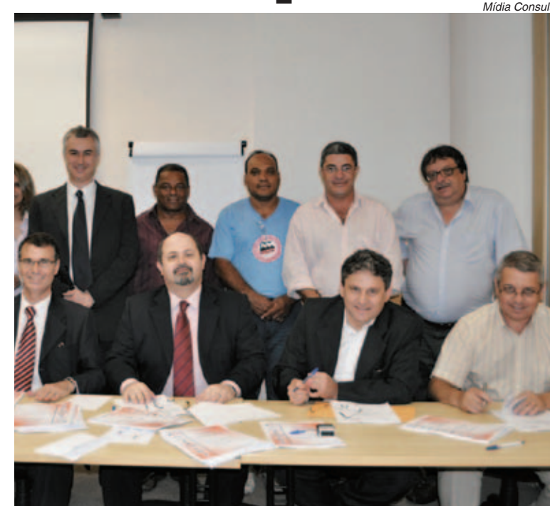
Bancadas da FEM e G 10 assinam acordo

Uma novidade com estas duas bancadas patronais foi a criação de uma terceira faixa de piso salarial para as micro empresas com até 35