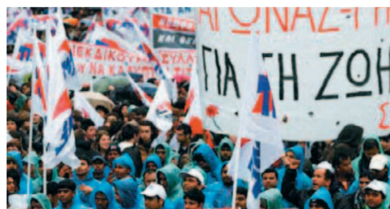
Gregos saem às ruas contra corte de salário e aumento dos impostos

Trabalhadores gregos cruzaram os braços por 24 horas ontem, para protestar contra as duras medidas econômicas anunciadas pelo governo.