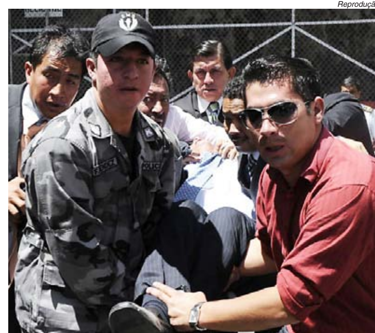
O presidente do Equador, Rafael Correa, é carregado após ser atingido por gás lacrimogênio em protesto de policiais

Em resposta à rebelião, centenas de pessoas se reuniram diante do palácio presidencial para manifestar