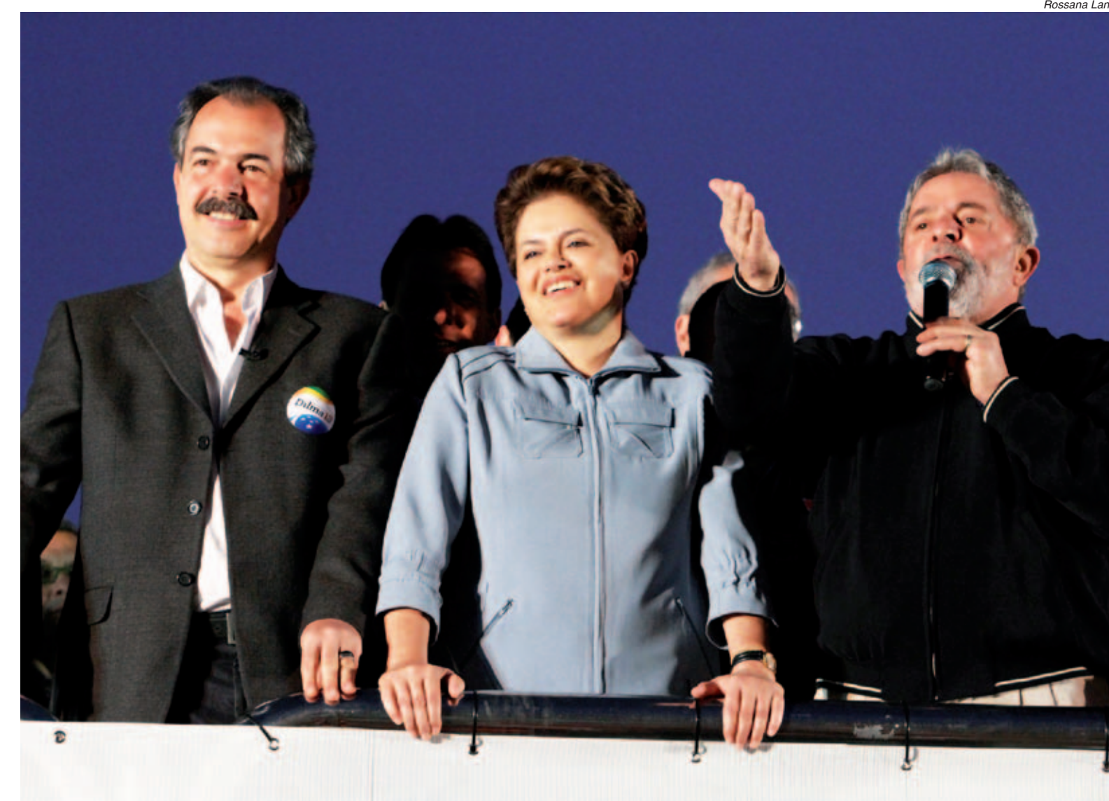
Mercadante, Dilma e Lula durante ato de campanha em frente a Mercedes

No Ibope, Dilma alcança 50% das intenções de voto, Serra 27% e Marina 13%. A soma de votos dos adversários não é suficiente para derrotar a petista no primeiro turno.