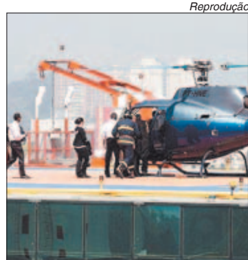
Itaú usa helicóptero para furar greve