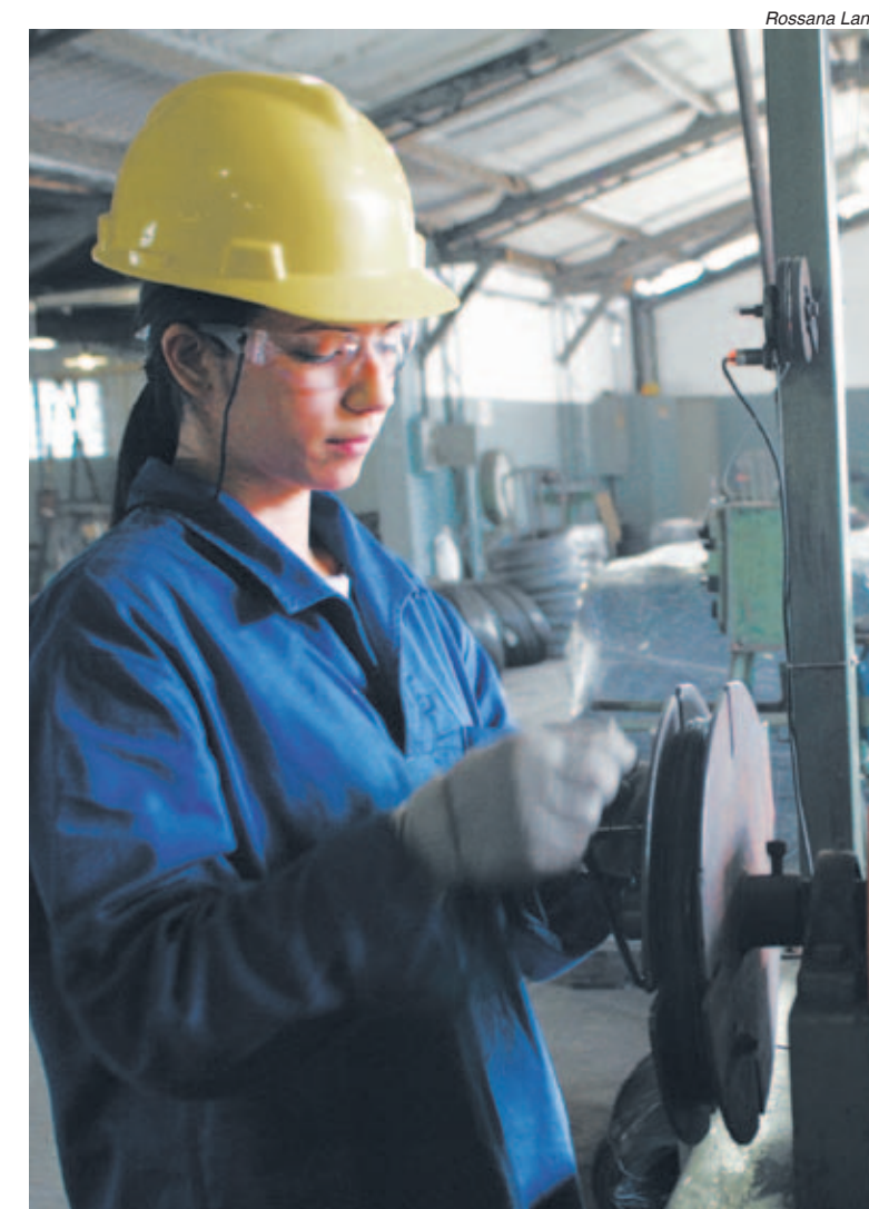
Políticas do governo Lula resultam em recordes de contratações

milhão de metalúrgicos empregados no Brasil. O nível mais crítico chegou no ano 2000, com 1,315 mil postos de trabalho e se encerrou com 1,428 milhão de vagas no ano de 2002.