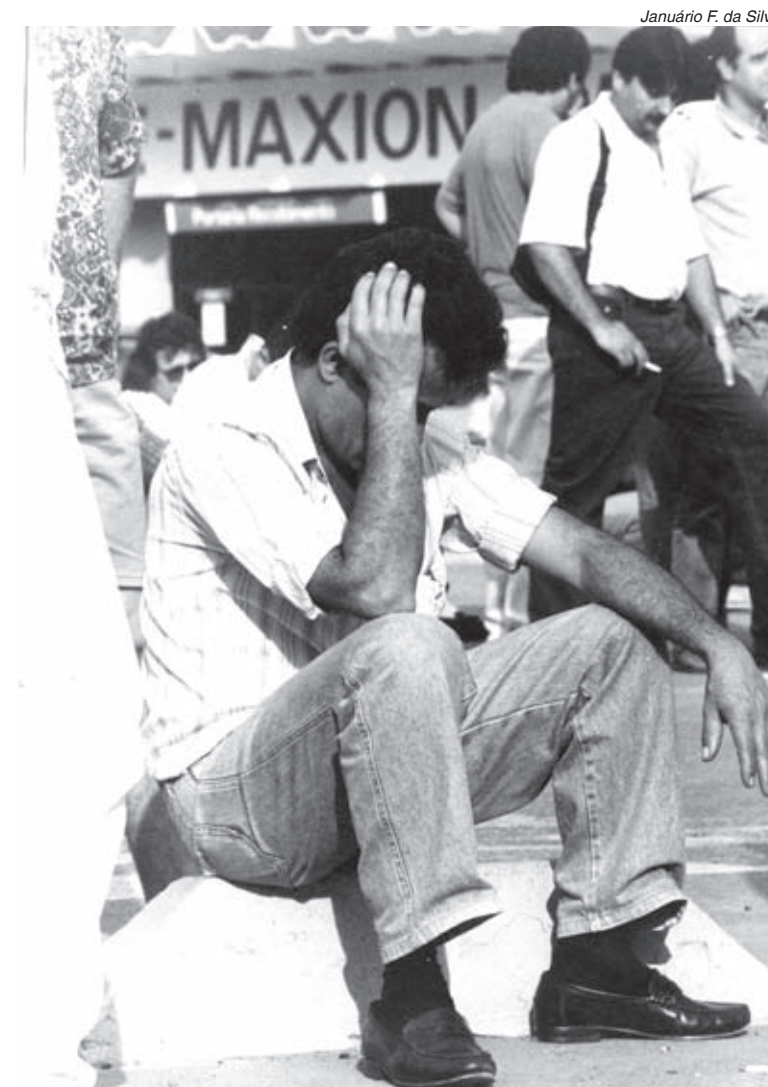
Maxion fecha e demite todo mundo. Marca da recessão tucana