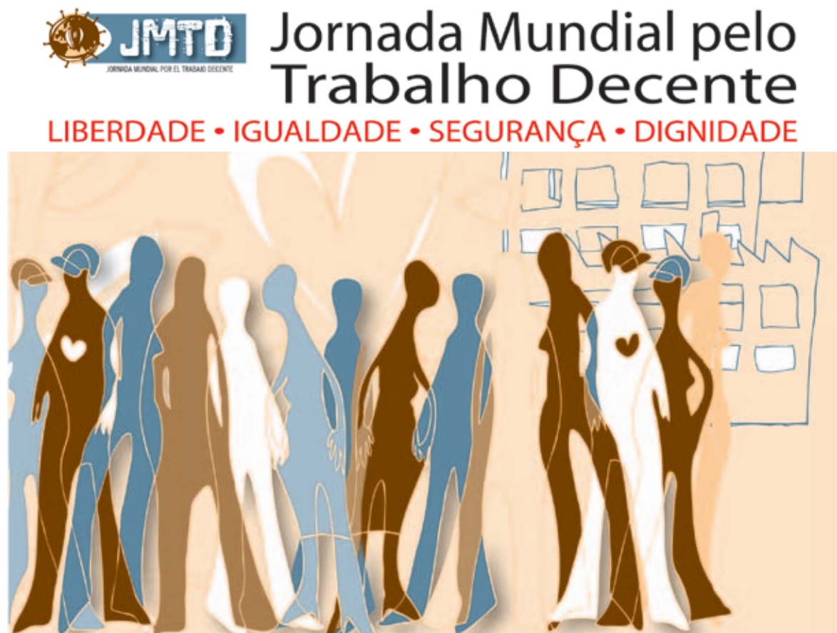
Cartaz das centrais sindicais para a mobilização de hoje