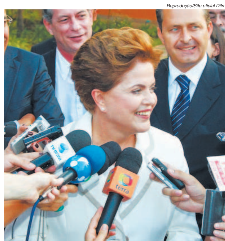
Dilma avisou que todas as calúnias serão respondidas

O ministro das Relações Institucionais, Alexandre Padilha, disse que o presidente Lula não irá se licenciar do cargo para ajudar na campanha, mas que continuará trabalhando para que Dilma seja eleita no dia 31 de outubro.