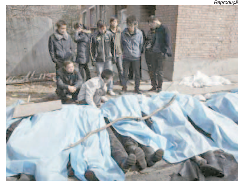
Imprensa não deu destaque para os mineiros mortos na China

A presença da mídia teria, pelo menos, chamado