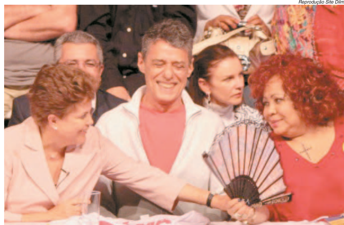
Dilma recebeu o apoio de mais de três mil artistas no Rio, entre elas Chico Buarque e Alcione

Segundo o Vox Populi, 89% dos entrevistados disseram estar decididos,