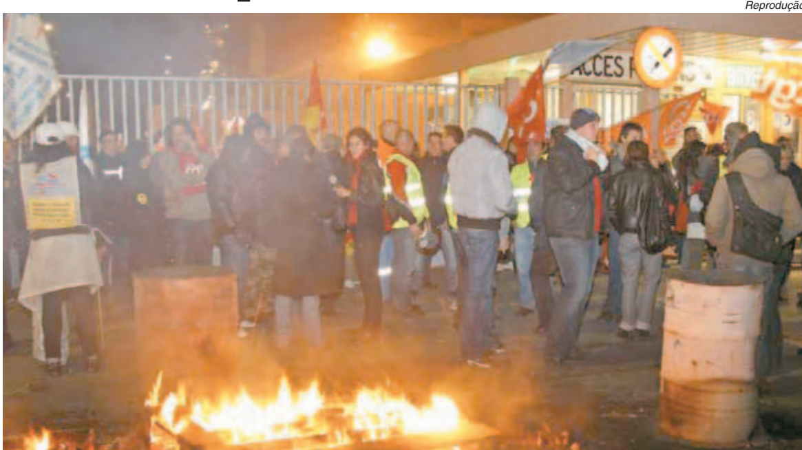
Trabalhadores em greve bloqueiam a entrada da refinaria de petróleo de Grandpuits

A França viveu ontem o sexto dia de greves e de protestos contra a reforma da Previdência proposta pelo governo que prevê o aumento da idade mínima de aposentadoria de 60 para 62 anos.