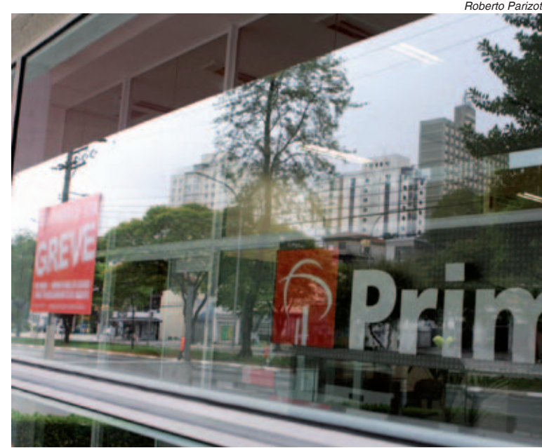
Sem aumento real, categoria vai ficar parada

“A categoria não vai sair desta campanha sem aumento real de salário, além de piso e PLR maiores”, afirmou.