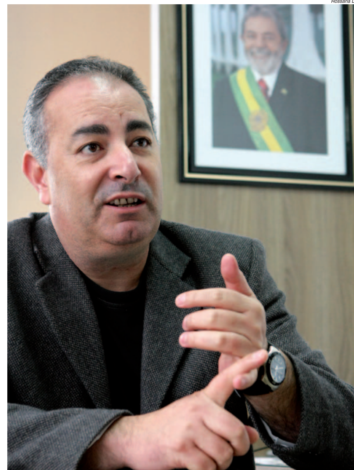
O presidente do Sindicato disse que o projeto do PSDB-DEM é prejudicar o povo com salário arrojado e privatização

co na rua para mostrar essa diferença, confirmar o voto da maioria em nossa candidatura e virar o voto de quem está indeciso.