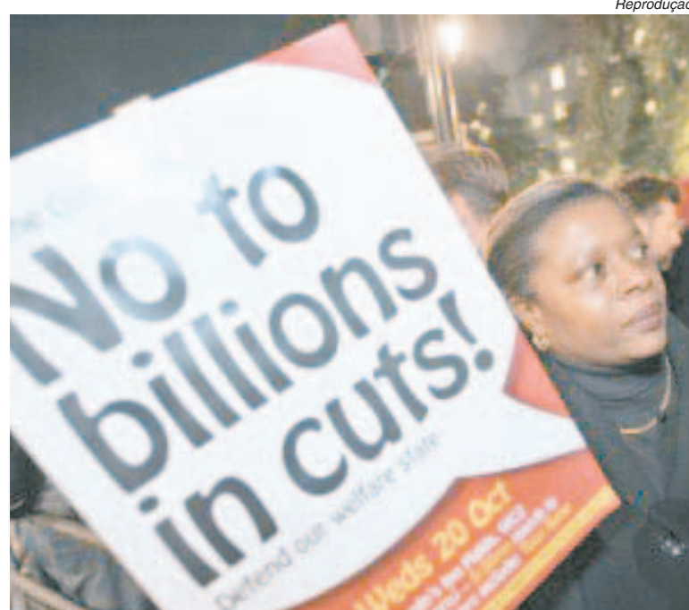
Um das cerca de três mil pessoas que participaram de protestos em Londres, na quarta-feira

No Brasil a crise foi derrotada, a economia cresce e o emprego bate recordes (leia na página ao lado). Já na Inglaterra o governo acabou de anunciar um novo corte de gastos, a demissão de 490 mil funcionários públicos e a elevação da idade para a aposentadoria de 65 para 66 anos.