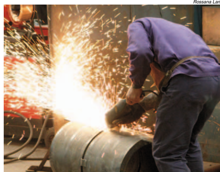
O setor industrial liderou a criação de empregos

pregos formais criados em outubro, o Brasil está perto de superar, com um mês de antecedência, meta estabelecida pelo governo federal para geração de empregos em 2010.