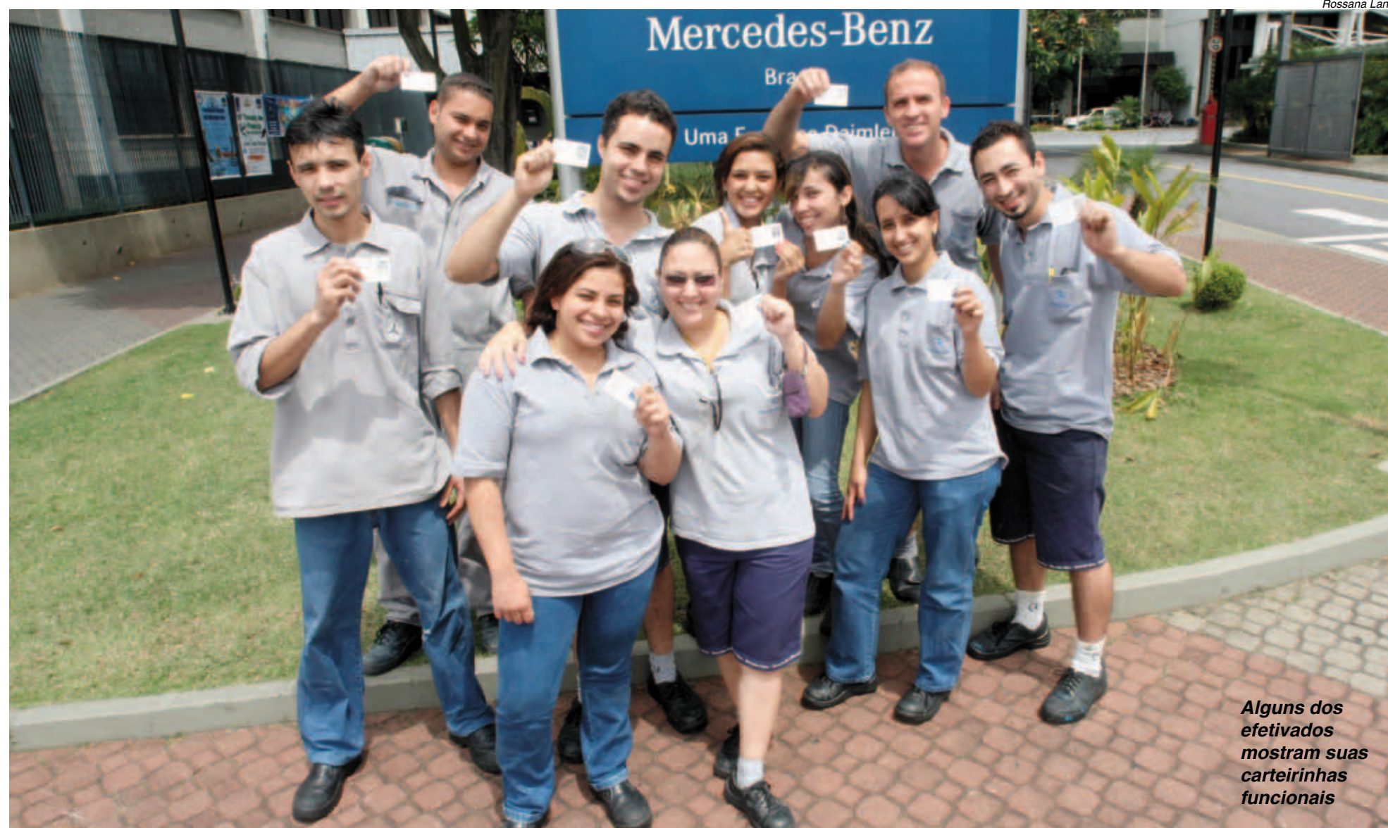
Alguns dos efetivados mostram suas carteirinhas funcionais

Resultado da luta pelo emprego, efetivação trouxe segurança e criou um clima de comemoração entre os companheiros