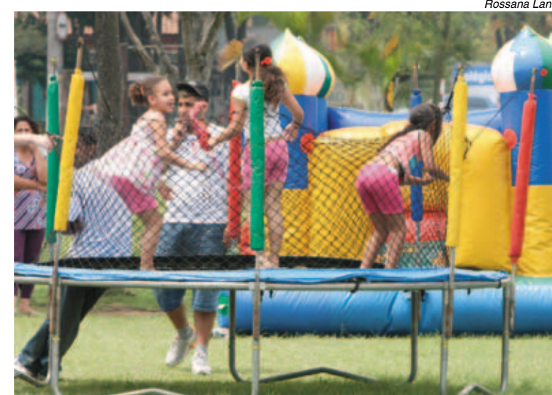
Crianças se divertiram nos brinquedos instalados na área verde

Na Praça da Moça, barracas apresentaram exposições de sindicatos, a Unisol Brasil mostrou trabalhos de empreendimentos de economia solidária, formação profes-