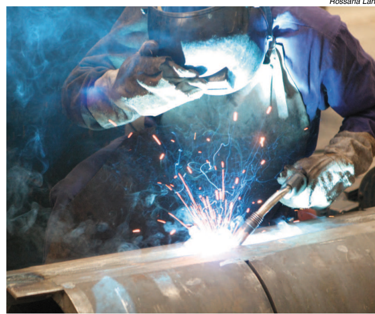
Abertura de postos de trabalho na região fez desemprego cair

No País, com a redução de 116 mil desempregados na comparação com setembro, as taxas médias de desemprego nas sete regiões pesquisadas voltaram a cair e passaram de 11,4% para 10,8%, também o menor índice da série histórica.