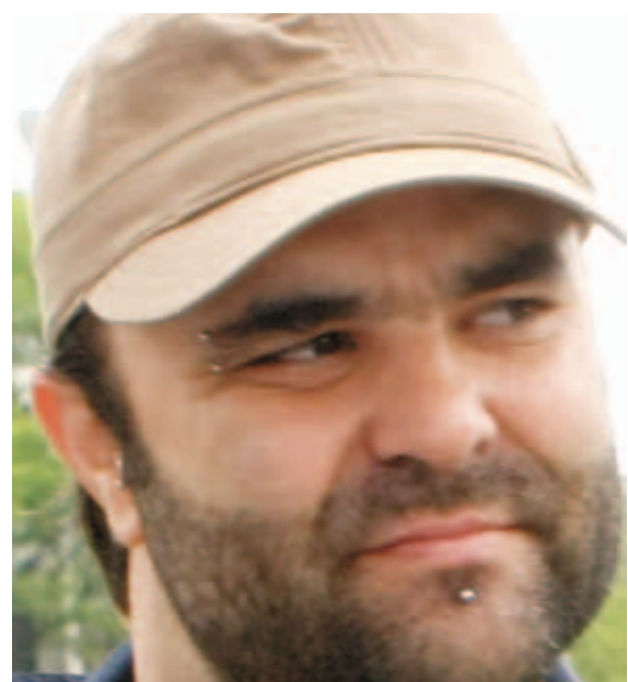
Max, novos desafios

A base da conversa é o livro Juventude Metalúrgica e Sindicato no ABC Paulista