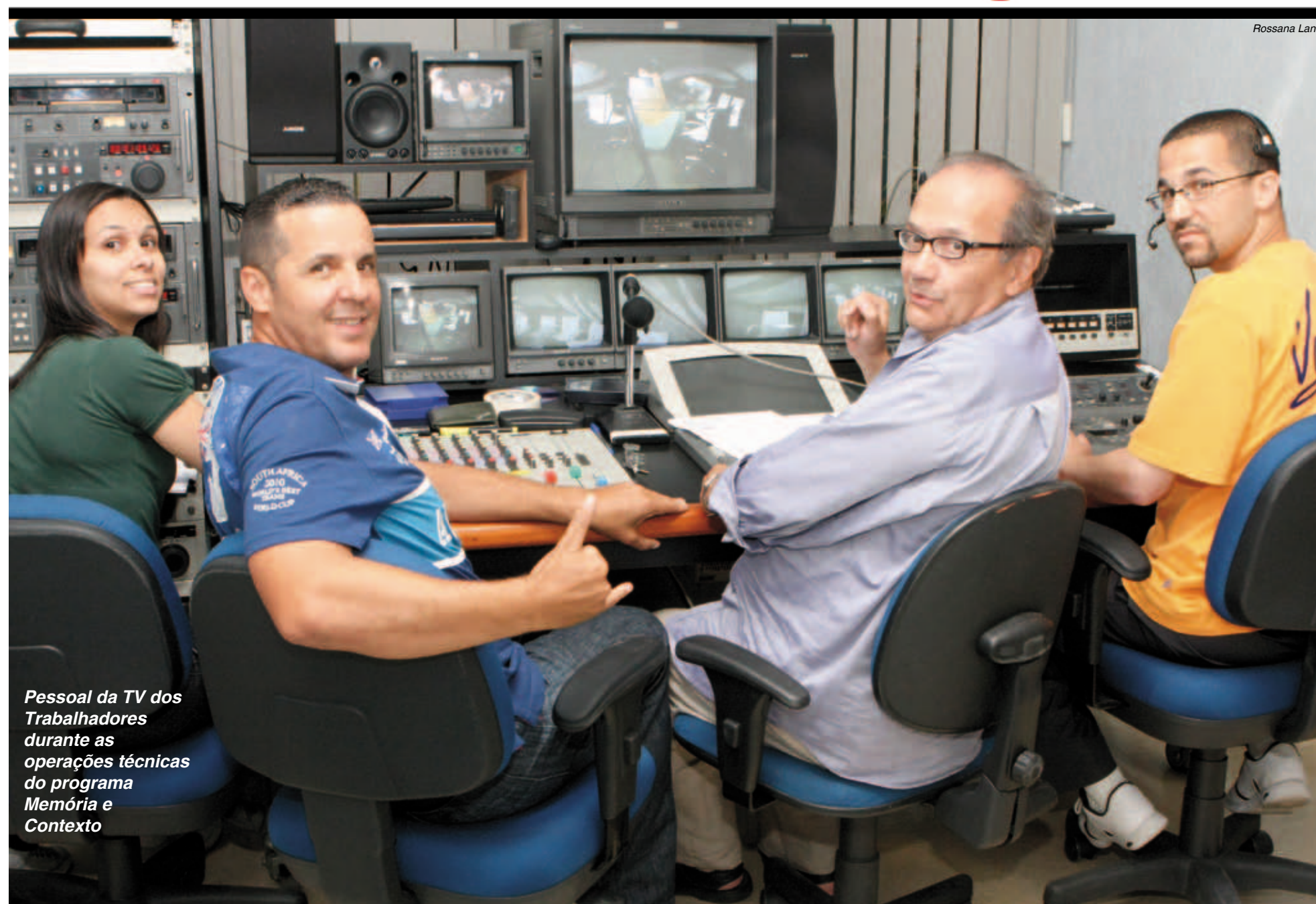
Pessoal da TV dos Trabalhadores durante as operações técnicas do programa Memória e Contexto