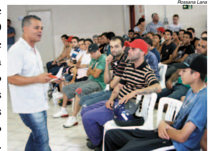
Boquinha comanda aula inaugural