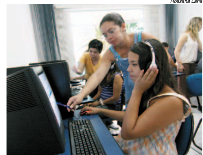
Alunos do MOVA Digital durante aula em ambiente online