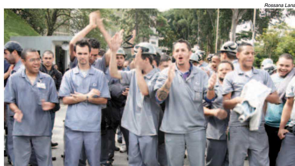
Na Brasmetal, trabalhadores aplaudiram aprovação da proposta

Junto à renovação do acordo, os companheiros aprovaram um plano de luta pela tabela de cargos e salários e querem participar da escolha do convênio médico que irá substituir o atual.