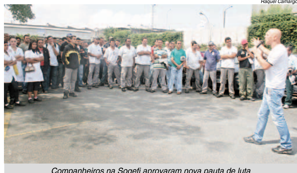
Companheiros na Sogefi aprovaram nova pauta de luta