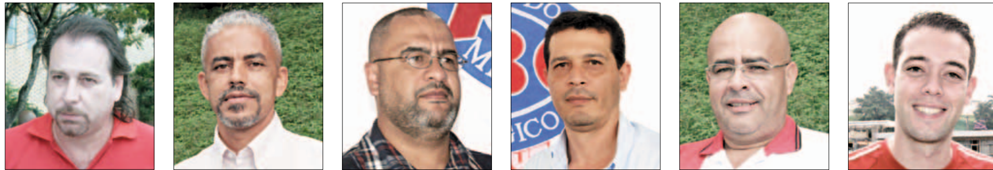
Reinaldo Marques Frangão José Roberto Bigodinho Valdir Freire Chalita Luiz Carlos Luizão Gerson Pereira Gerson Wellington Messias Wellington