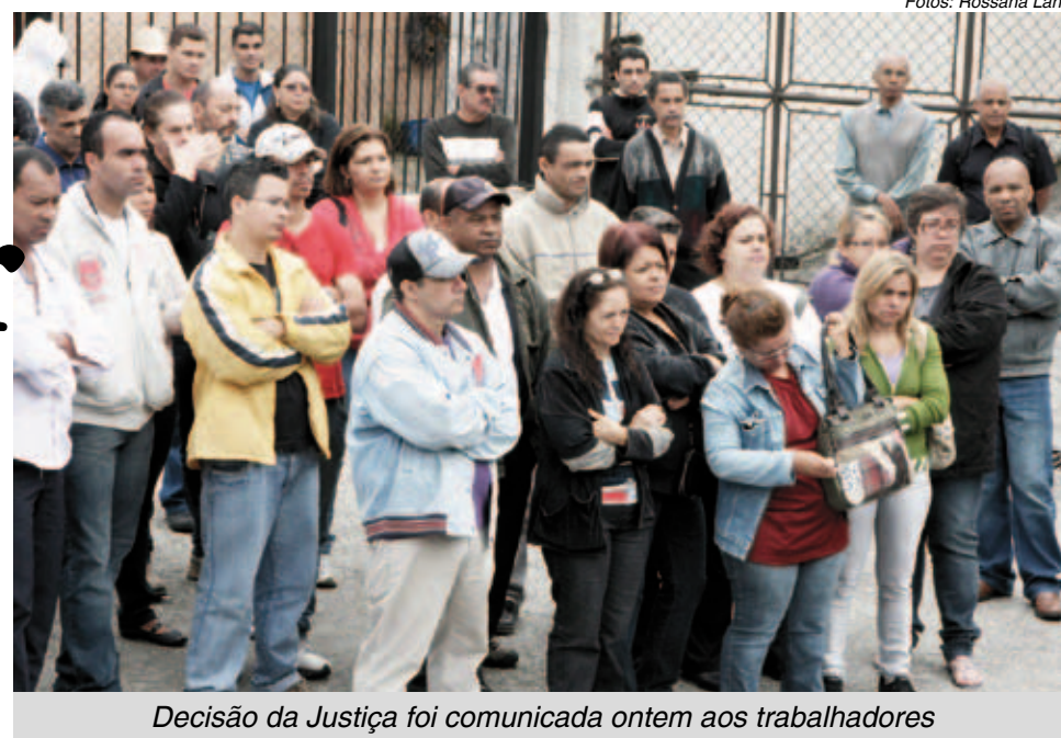
Decisão da Justiça foi comunicada ontem aos trabalhadores

“Agora que os bens estão indisponíveis quem sabe ela entre em contato com o Sindicato”, comentou.