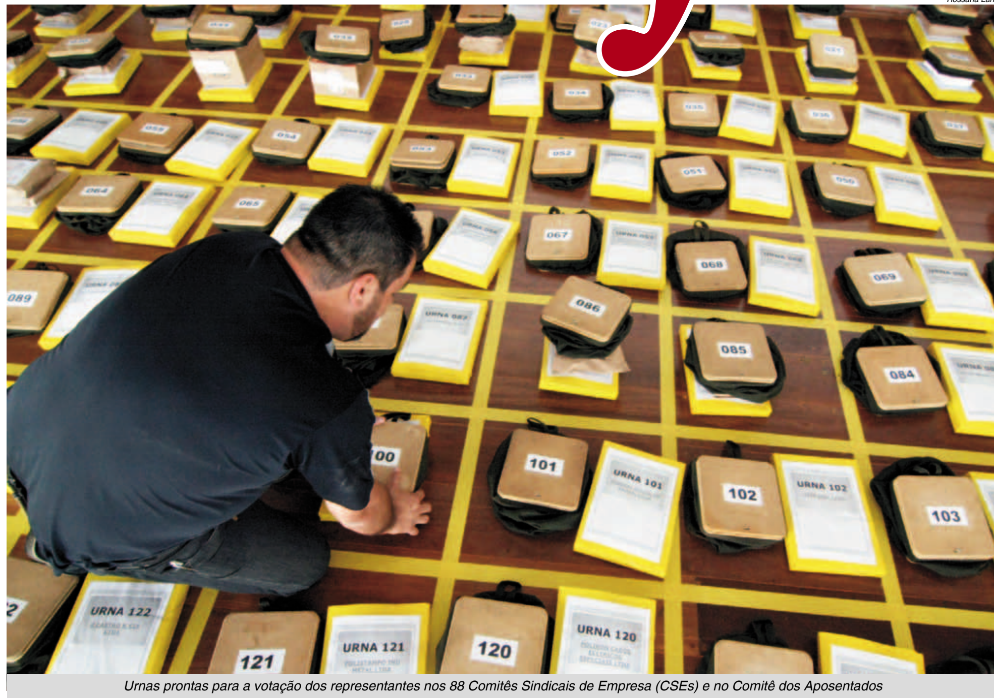
Urnas prontas para a votação dos representantes nos 88 Comitês Sindicais de Empresa (CSEs) e no Comitê dos Aposentados