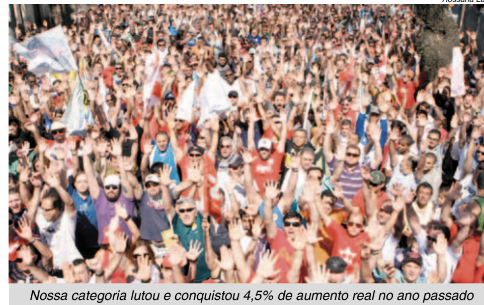
Nossa categoria lutou e conquistou 4,5% de aumento real no ano passado

Em 2009, 79% tiveram aumento real, 12% reposição da inflação e 9% fizeram