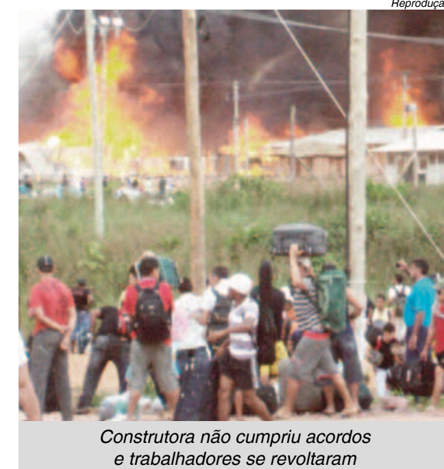
Construtora não cumpriu acordos e trabalhadores se revoltaram

Após negociação com o sindicato da construção civil no Estado e a CUT, aproximadamente três mil desses trabalhadores