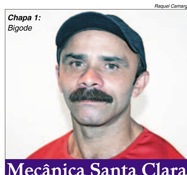
Chapa 1: Bigode