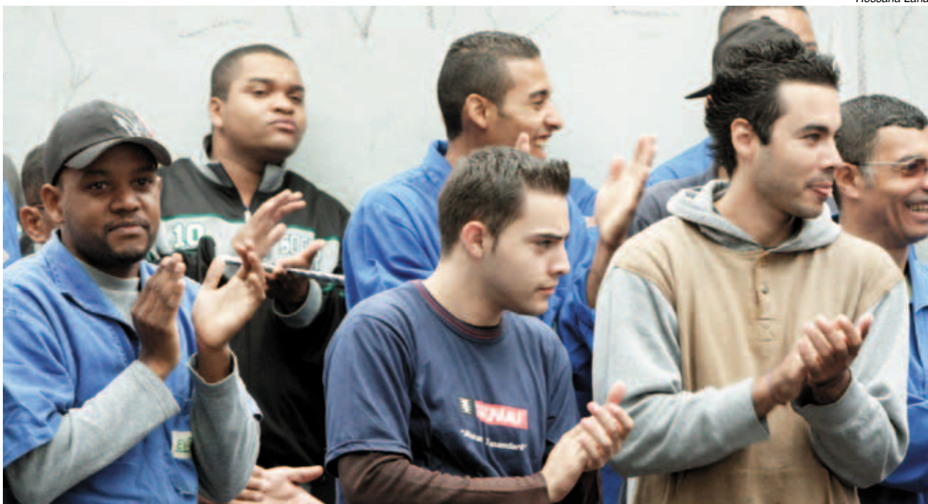
Trabalhadores voltaram a trabalhar em estado de alerta

A Justiça do Trabalho declarou legal a greve na Evacon , em Diadema, e obrigou a empresa a negociar com o Sindicato e pagar os dias parados.