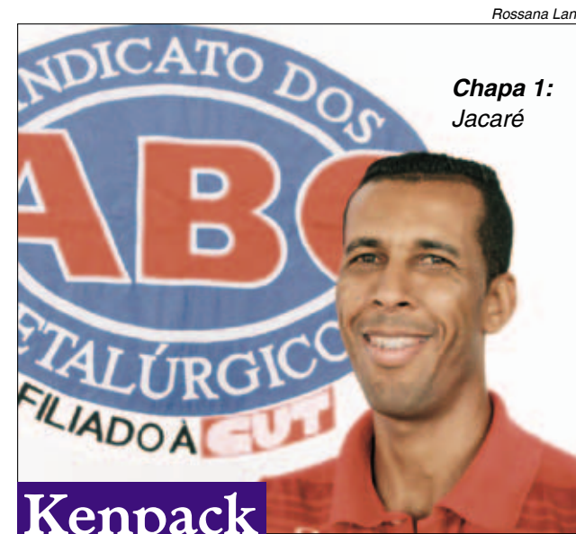
Chapa 1: Jacaré