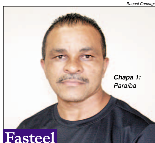
Chapa 1: Paraíba