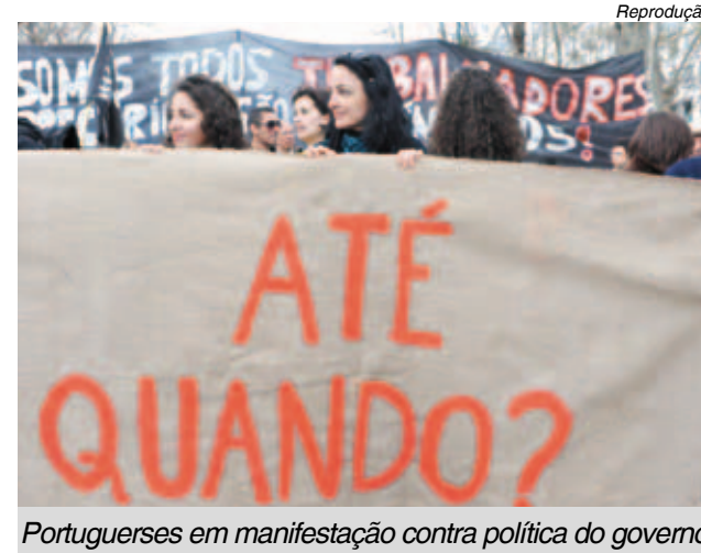
Portugueses em manifestação contra política do governo

Depois de Grécia e Irlanda, Portugal também jogou a toalha e pediu ajuda financeira à União Europeia. Ainda não existem números oficiais, mas analistas estimam o valor do empréstimo em R$ 195 bilhões.