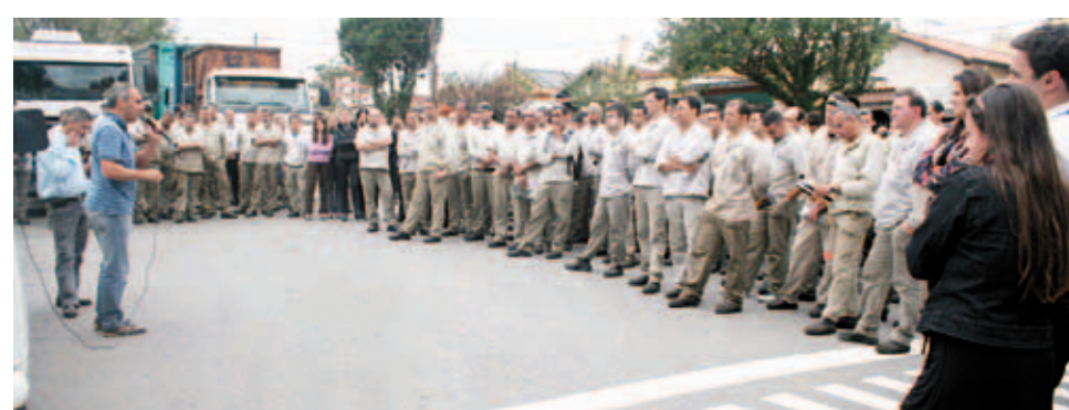
Já a companheirada na Mangels quer a reabertura das negociações