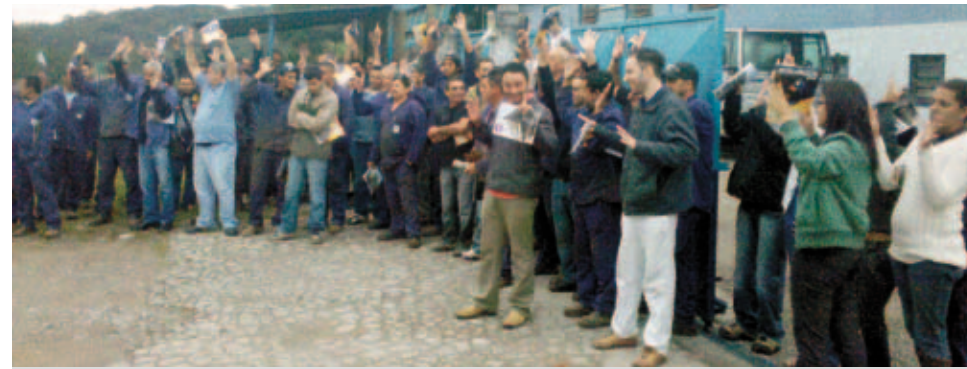
Na Heat Mac, braços levantados, metalúrgicos aprovam acordo

proposta por não concordar com as metas e os valores. O aviso de greve já foi entregue à fábrica. O aviso de greve também está com direção da Tecnoservice , em Diadema, depois que as propostas foram rejeitadas porque os trabalhadores não aceitaram os valores, em assembleia mantida na semana passada.