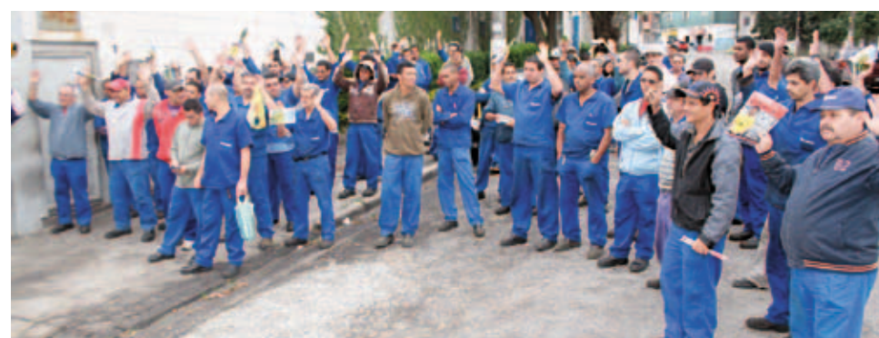
Também na Selmec os trabalhadores fizeram acordo