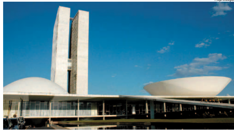
Para a categoria, reforma dará mais equilíbrio nas forças do Congresso