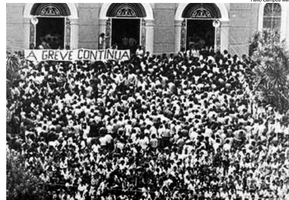
O novo sindicalismo – mobilização na Igreja Matriz durante a greve de 1980

Este novo sindicalismo é o principal responsável pela derrubada da ditadura militar e, desde então, participa de todos os movimentos em defesa da ci-