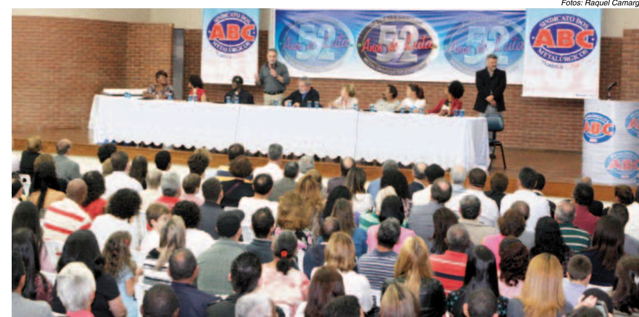
Comemoração de aniversário do Sindicato lotou a Sede e homenageou entidades e personalidades

“Realizamos 73 conferências nacionais para decidir as