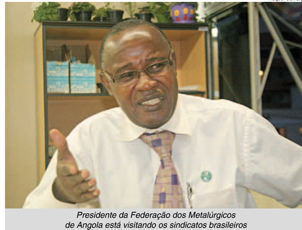
Presidente da Federação dos Metalúrgicos de Angola está visitando os sindicatos brasileiros

Os trabalhadores associados cotizam com 1% do salário. O dinheiro vai para o sindicato provincial, que envia 10% desse valor para as comissões para despesas de rotina, como compra de material de escritório, computador ou material de apoio administrativo da Comissão Sindical.