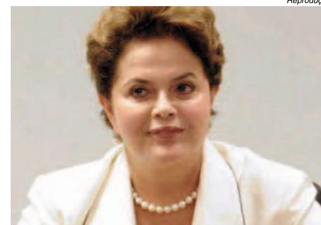
Dilma quer mais mulheres nos espaços de decisão

A inscrição é feita com os membros dos CSEs.