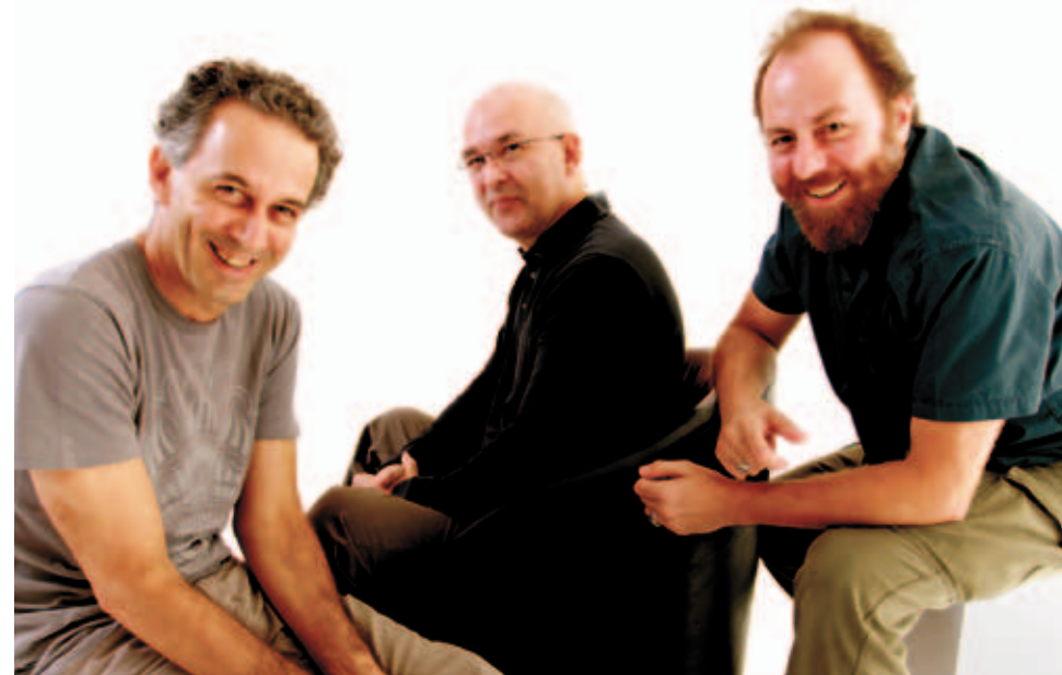
O grupo Paralamas do Sucesso vai fazer show na etapa final do festival

Para se ter ideia da importância destes encontros, seu site divulgou 62 festivais no ano passado, mas Sérgio calcula que perto de