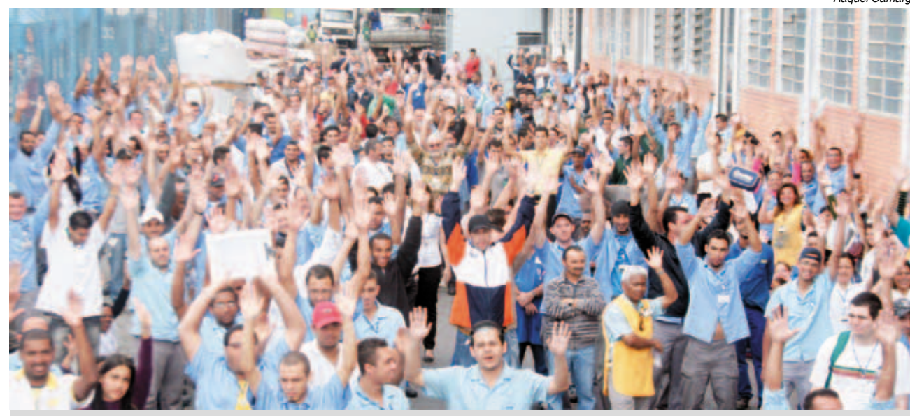
Trabalhadores não concordaram com o valor e com a demora na implantação do vale

Agora, eles querem a reabertura das negociações para melhorar a proposta de acordo.