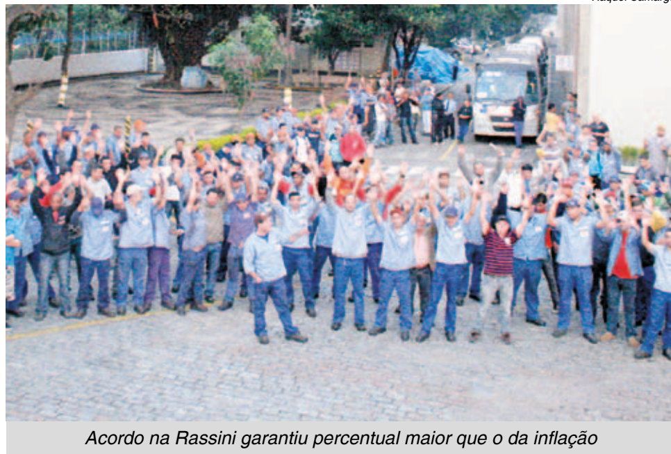
Acordo na Rassini garantiu percentual maior que o da inflação

Na Cofap , a assembleia aconteceu à tarde e a aprovação foi