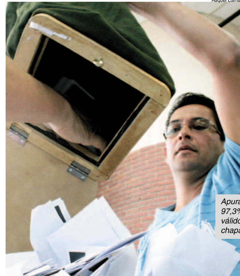
Apuração apontou 97,3% dos votos válidos para a chapa 1

A posse oficial da nova direção será dia 19 de julho e a festiva dois dias antes, dia 17.