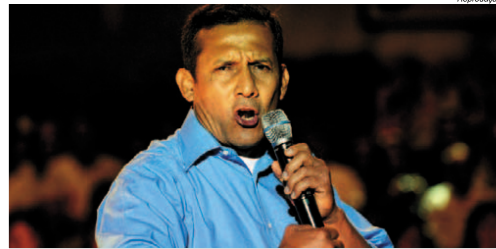
Desafio de Humala é distribuir renda e melhorar a vida do povo peruano

Ollanta Humala ganhou as eleições de domingo contra a con-