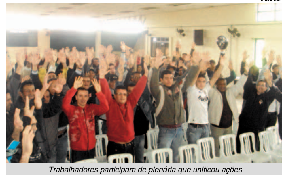
Trabalhadores participam de plenária que unificou ações

A unidade foi selada em plenária no último domingo, da qual participaram os companheiros na Proema 1, Proema 2, SEA, A+Z e AMX. Exceto essa última, que é do ramo de manutenção, as demais são fábricas de autopeças. Juntas,