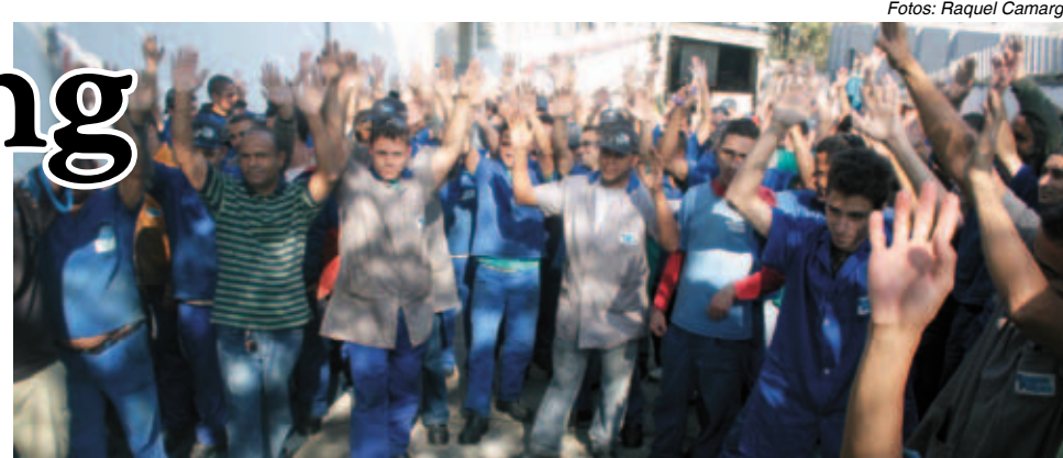
Na Magno Peças , a PLR será paga ao pessoal afastado por doença no trabalho

O restaurante ficará pronto no final de julho, mesma época que começa o descanso em sábados alternados.