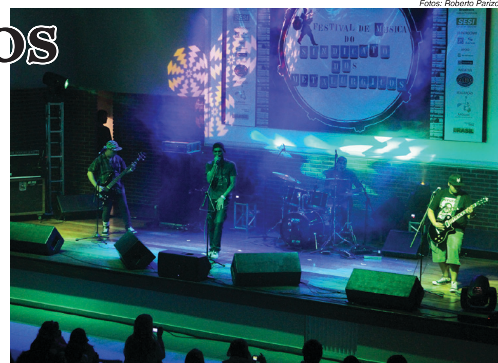
Palco recebeu show de luzes nas apresentações

Seis músicas disputarão a final dia 17 de julho no Estância Alto da Serra, data da posse da nova diretoria do Sindicato, com shows dos Paralamas do Sucesso e Rappin' Hood.