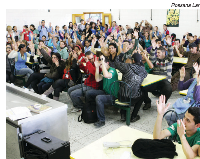
Companheiros na Alumbra conseguiram um bom reajuste

que havia sido rejeitada no começo do mês. Os pagamentos saem em julho e em janeiro do ano que vem.