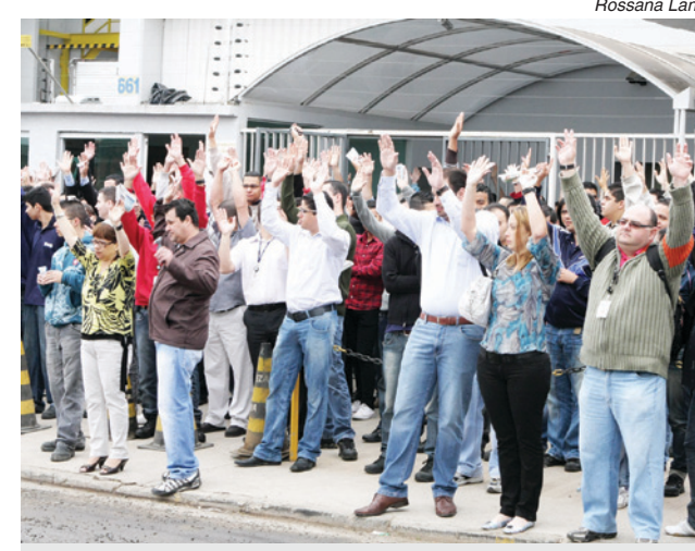
Acordo na SMS tem validade de dois anos

Na Alumbra, empresa de material elétrico em São Bernardo, os 400 companheiros conseguiram adiantar