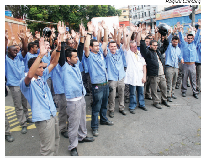
Na Ardeb Diadema, o primeiro acordo de PLR