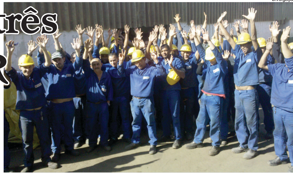
Protesto realizado na Cabomat fez empresa melhorar proposta

A primeira parcela sairá em julho e a última em janeiro do ano que vem.