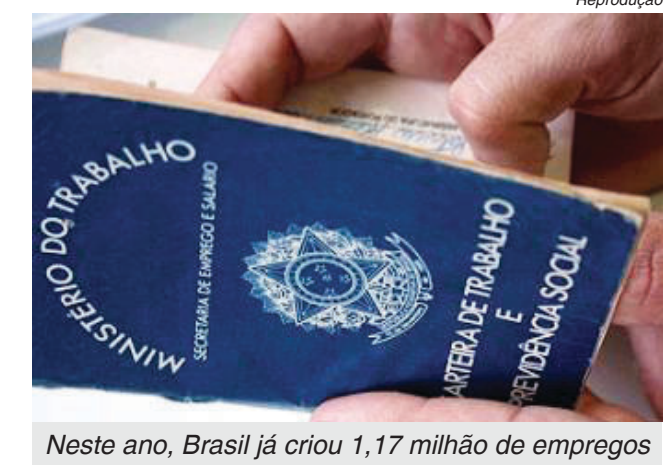
Neste ano, Brasil já criou 1,17 milhão de empregos

de maio foram os setores de agricultura (saldo de 79.584 empregos formais), serviços (71.246), indústria (42.301) e construção