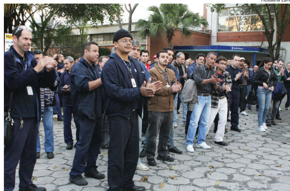
Trabalhadores foram informados que fábrica vai retomar diálogo com o CSE