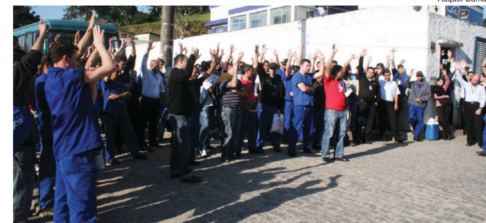
O bom reajuste na Mardel fez a PLR ter aprovação unânime