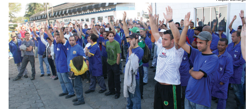
Trabalhadores na Ouro Fino querem novas negociações