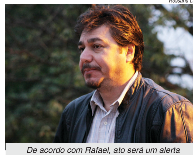
De acordo com Rafael, ato será um alerta

sindicatos decidiram que a mobilização vai antecipar a entrega à presidenta Dilma Rousseff e ao ministro do Desenvolvi-