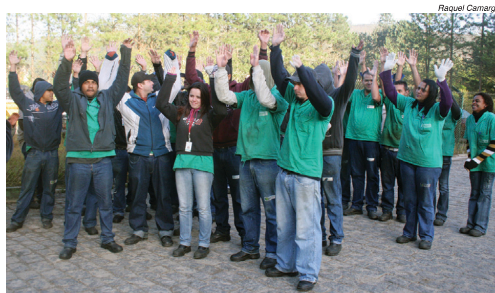
Companheiros na VMG rejeitam proposta por causa do valor