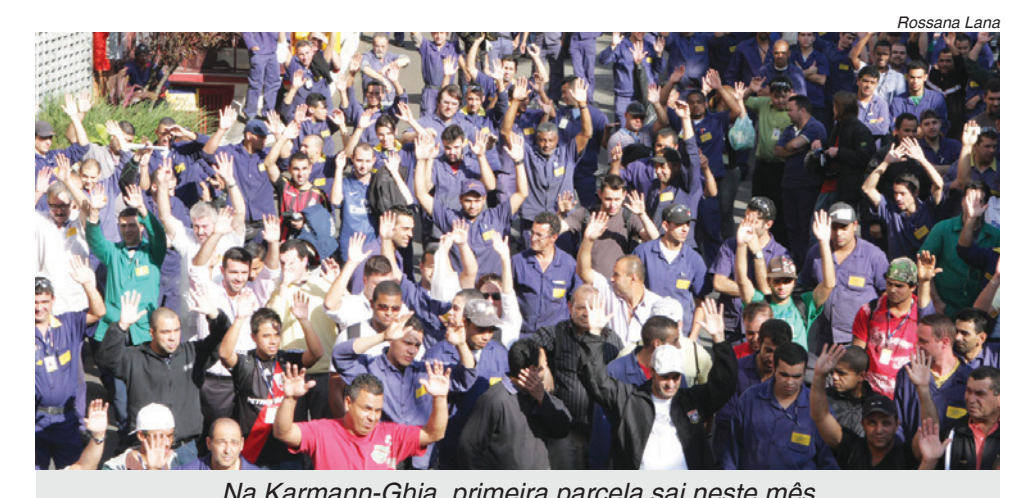
Na Karmann-Ghia, primeira parcela sai neste mês

Propostas foram aprovadas na Robrasa, Cabomat, Mextra, KGB, Zemza Zelicks, Daiwa, Mardel, General Dinamic e MZJF. Baixos valores causaram rejeição na Ouro Fino, Papaiz e VMG.