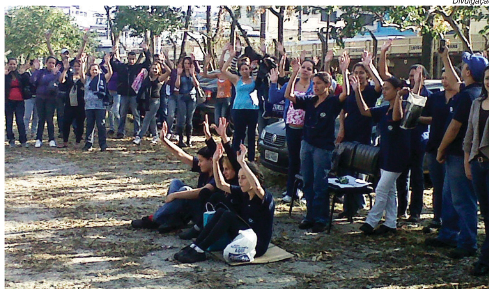
Na Daiwa, a primeira parcela será paga em agosto

Metalúrgicos de nove fábricas garantiram suas PLRs. Em três eles rejeitaram por causa dos valores.