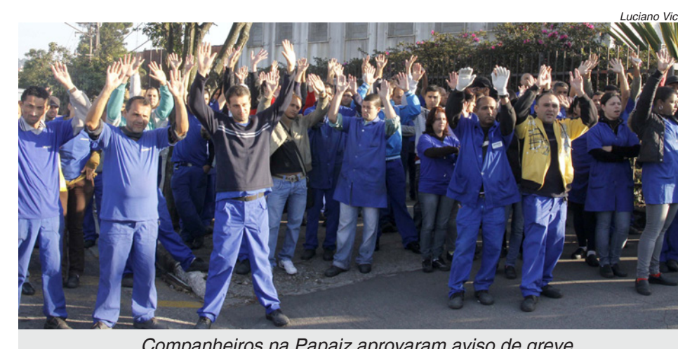
Companheiros na Papaiz aprovaram aviso de greve