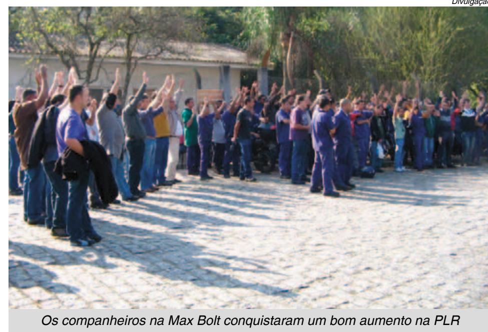
Os companheiros na Max Bolt conquistaram um bom aumento na PLR

autopeças em São Bernardo, os cerca de 120 trabalhadores também conquistaram um bom