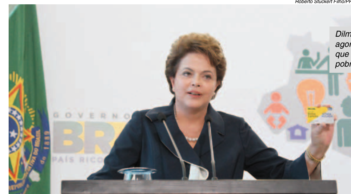
Dilma disse que, agora, é o governo que vai atrás do pobre

"A partir de agora, não é a população mais pobre que terá que correr atrás do Estado, mas o contrário", concluiu.