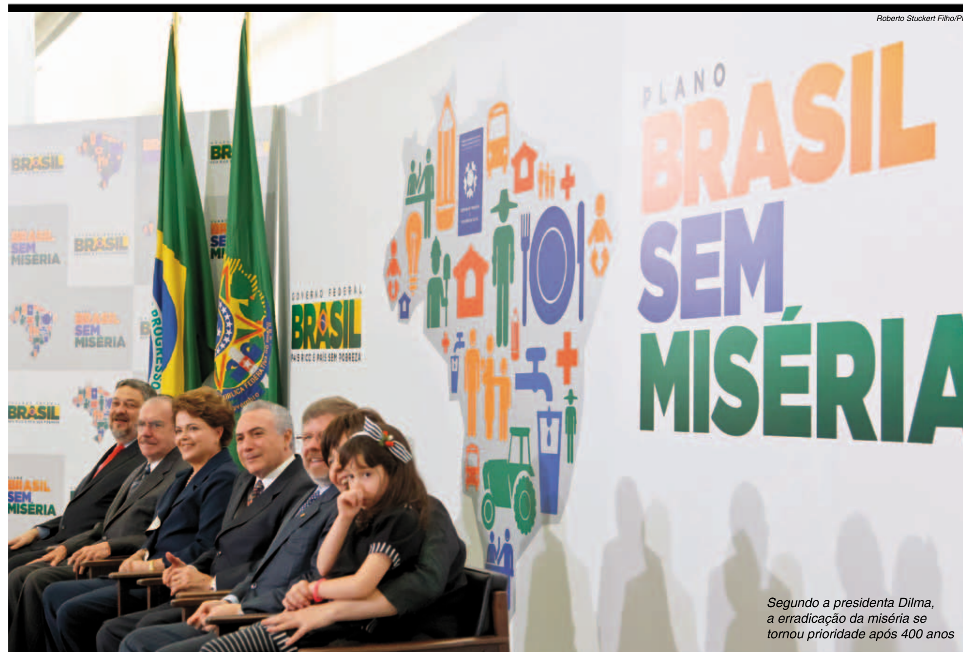
Segundo a presidenta Dilma, a erradicação da miséria se tornou prioridade após 400 anos

Domingo - 18h30 Santos x Avai (Vila Belmiro)