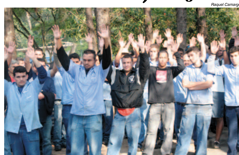
Os trabalhadores na Polimold vão receber a primeira parcela neste mês