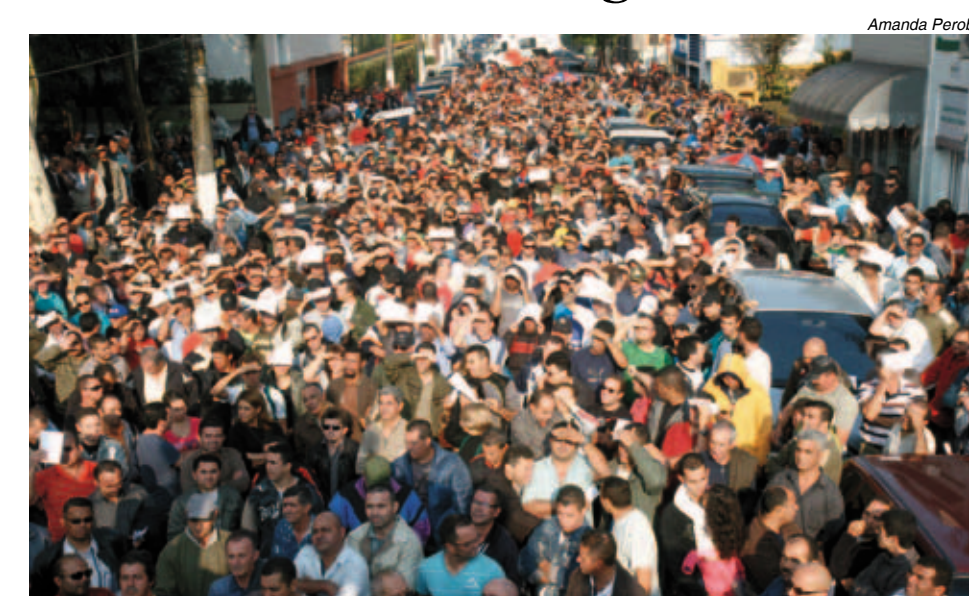
Assembleia da categoria decidiu prosseguir o movimento ontem

Motoristas e cobradores nas sete cidades do ABC prosseguem parados ao menos até as 9h de hoje. Neste horário haverá nova assembleia para avaliar o resultado da audiência de conciliação no Tribunal Regional do Trabalho, que continuava ontem até o fechamento desta edição da Tribuna. Eles lutam por 15% de reajuste.