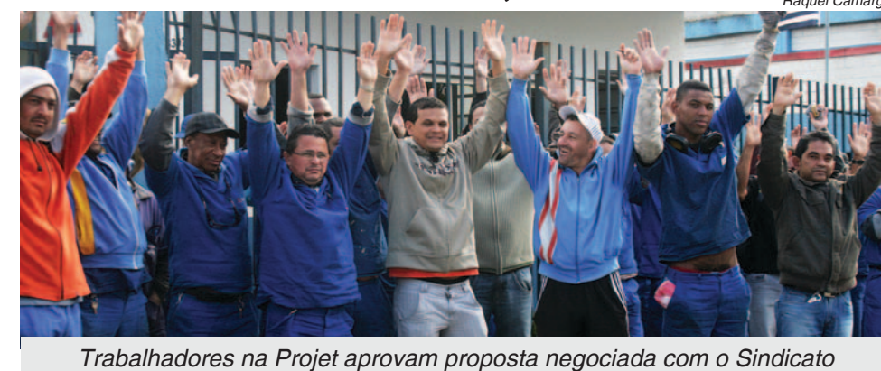
Trabalhadores na Projert aprovam proposta negociada com o Sindicato