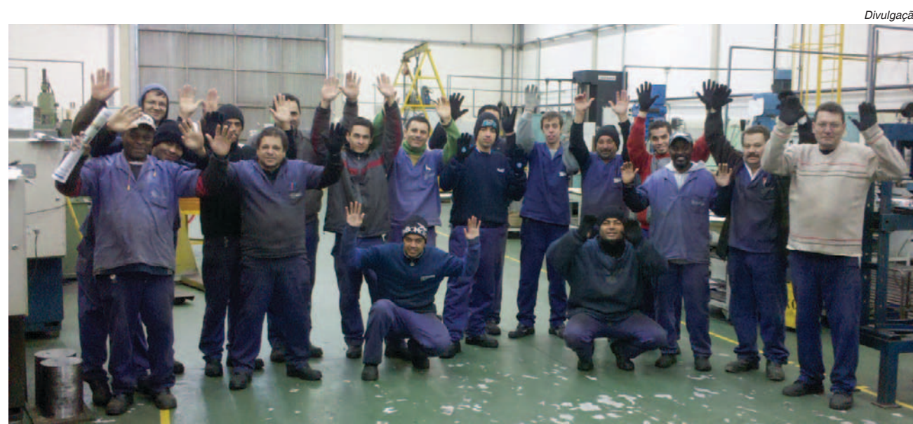
Na SS Ferramentaria, mobilização dos trabalhadores conquista primeira PLR