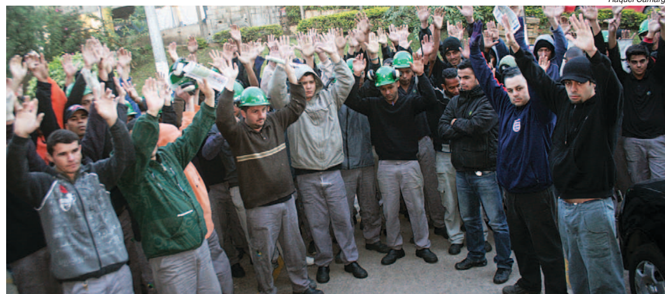
Companheiros na Fundição Estrela rejeitam proposta e pedem reabertura das negociações

Os pagamentos saem em junho e em janeiro de 2012.