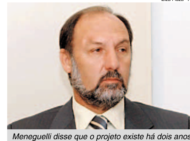
Meneguelli disse que o projeto existe há dois anos

possibilidade concreta de uma nova vida a partir de um processo educativo voltado para