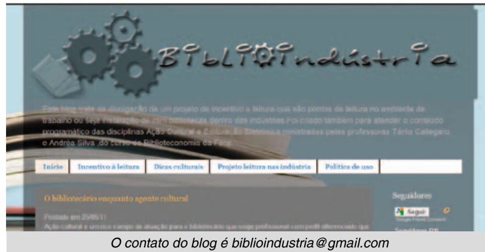
O contato do blog é biblioindustria@gmail.com

Seu maior desejo agora é atrair movimento para o site para que ele se torne um ponto de encontro de quem se interessa pelo projeto, conversas sobre literatura. E também por uma biblioteca na Mahle.