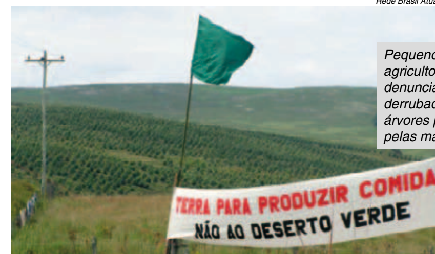
Rede Brasil Atual

Pequenos agricultores denunciam a derrubada de árvores promovida pelas madeireiras