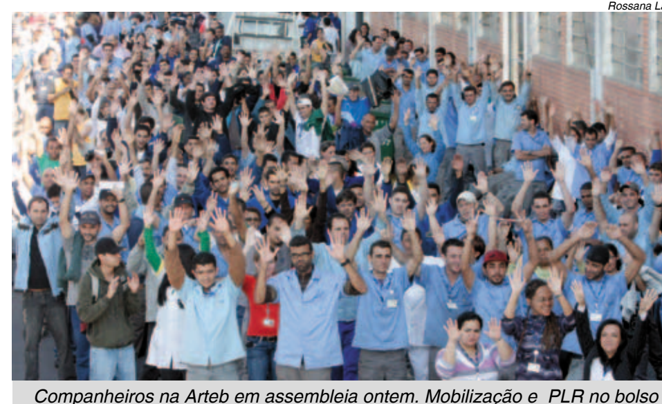
Companheiros na Arteb em assembleia ontem. Mobilização e PLR no bolso