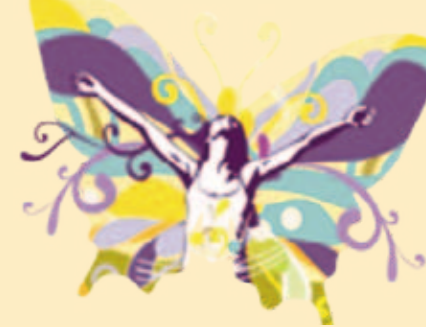
Logomarca do projeto

Os educadores envolvidos no projeto são capacitados para trabalhar o desenvolvimento dos jovens e adolescentes a partir do resgate de valores, da elevação da autoestima e do fortalecimento dos vínculos familiares.