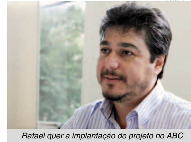
Rafael quer a implantação do projeto no ABC

“Queremos proporcionar a esses meninos e meninas o resgate da autoestima e a