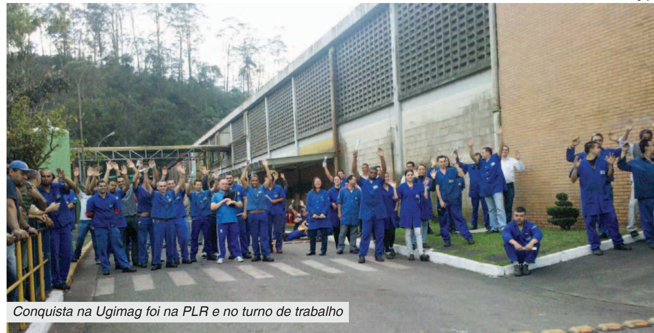
Conquista na Ugimag foi na PLR e no turno de trabalho

Os pagamentos sairão em outubro e em abril do ano que vem.