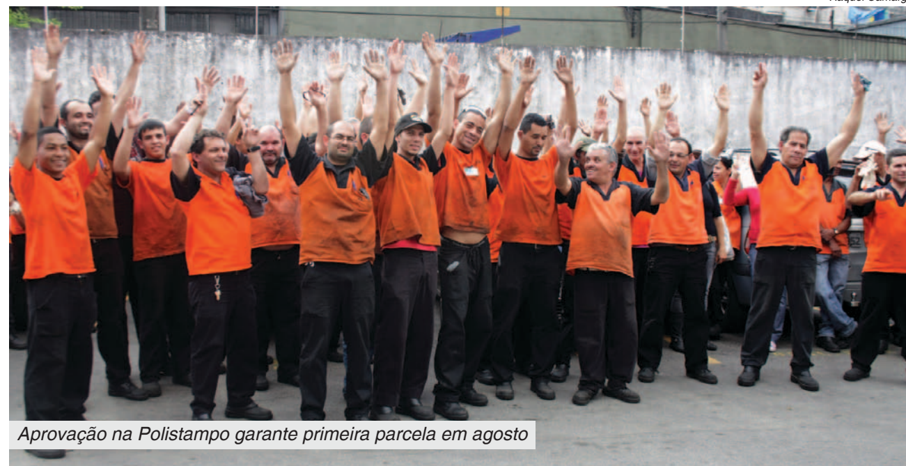
Aprovação na Polistampo garante primeira parcela em agosto