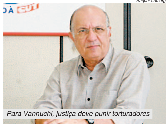
Para Vannuchi, justiça deve punir torturadores

"A Comissão terá a responsabilidade de apurar o que realmente aconteceu durante o período para que todos, principalmente os jovens saibam o que