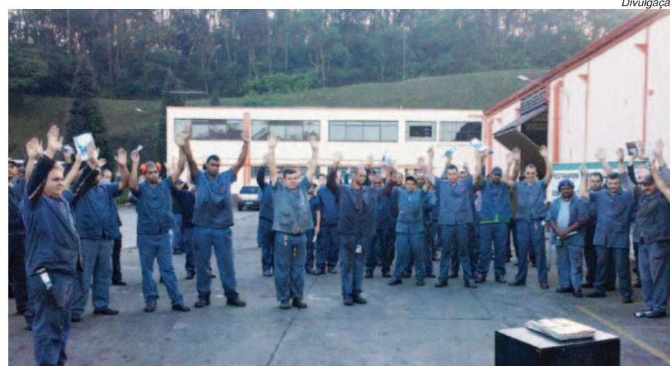
Conquista da companheirada na Unitec prevê PLR com um bom reajuste

Quando da realização da Semana Interna de Prevenção de Acidentes (SIPAT), as informações sobre a data e a programação devem ser enviadas com 30 dias de antecedência.