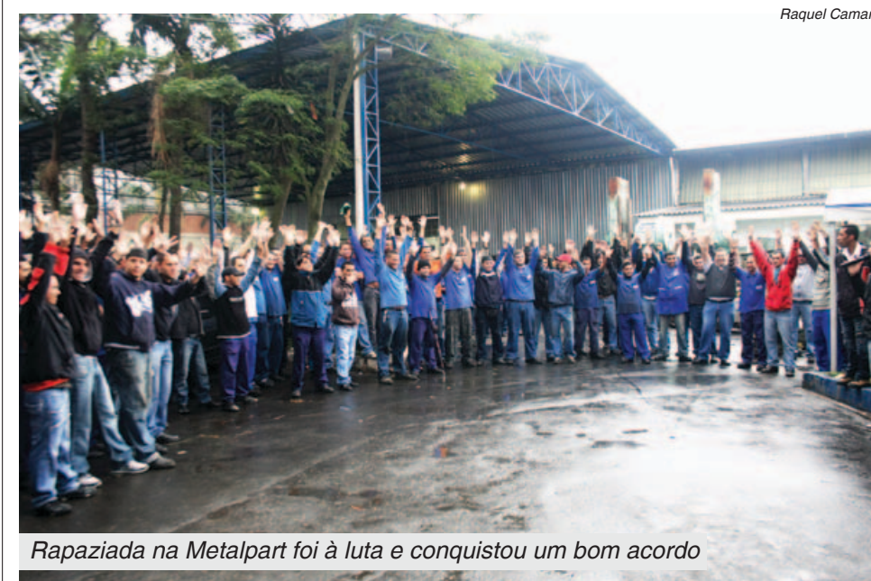
Rapaziada na Metalpart foi à luta e conquistou um bom acordo

Proposta foi aprovada após duas rejeições na Metalpart. Baixo valor também provou rejeição na Sky Laser.