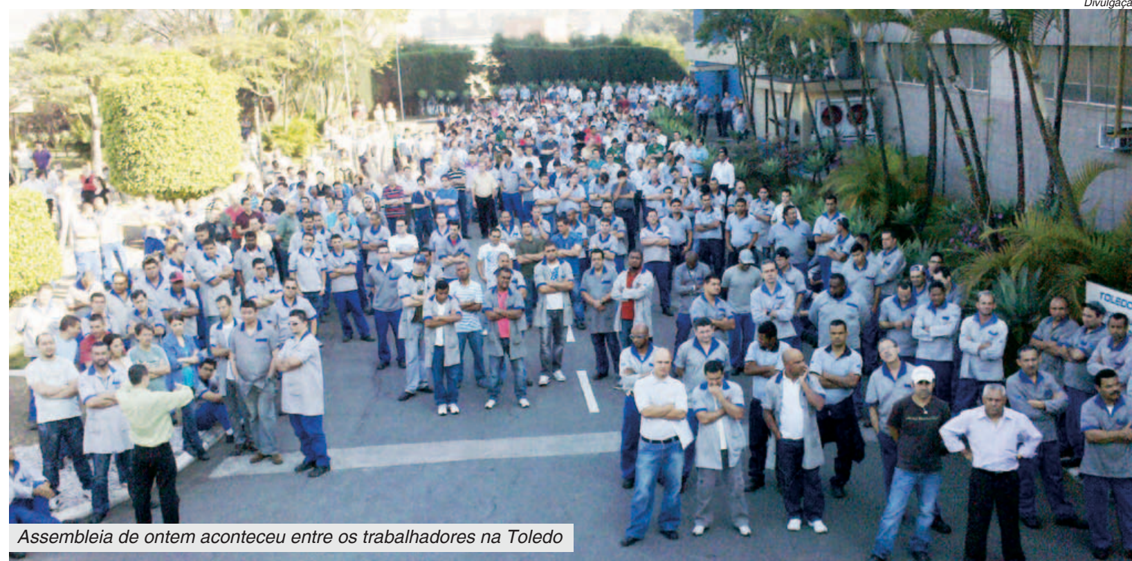
Assembleia de ontem aconteceu entre os trabalhadores na Toledo