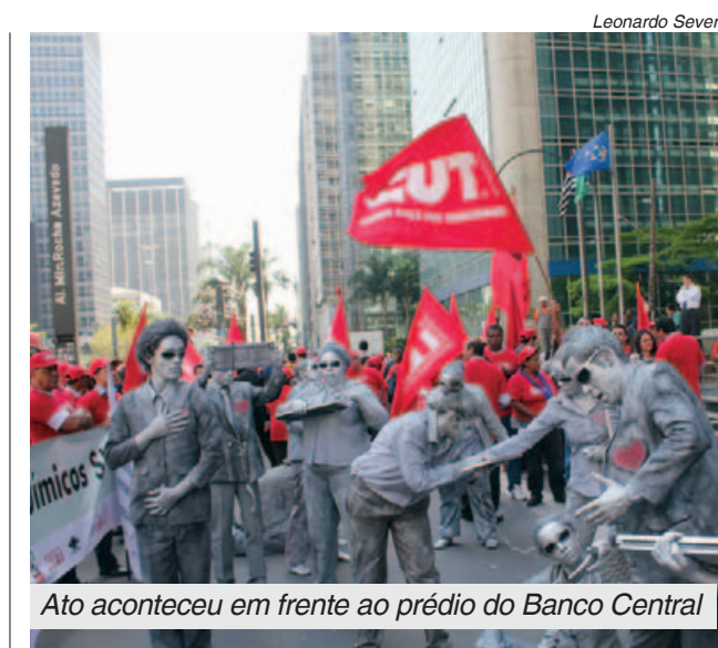
Ato aconteceu em frente ao prédio do Banco Central

O Espaço Solidário fica ao lado do CTR e funcionará de segunda à quinta, das 8h às 17h e as sextas, das 8h às 15h, na Rua Marechal Deodoro, 2316, esquina com a Rua Zelinda Zanella, Centro. Telefone 4128-1230.