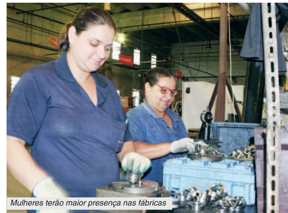
Mulheres terão maior presença nas fábricas

Convenção coletiva recomendará às empresas terem um mínimo de 30% de metalúrgicas. Negociações de campanha ainda prosseguem.