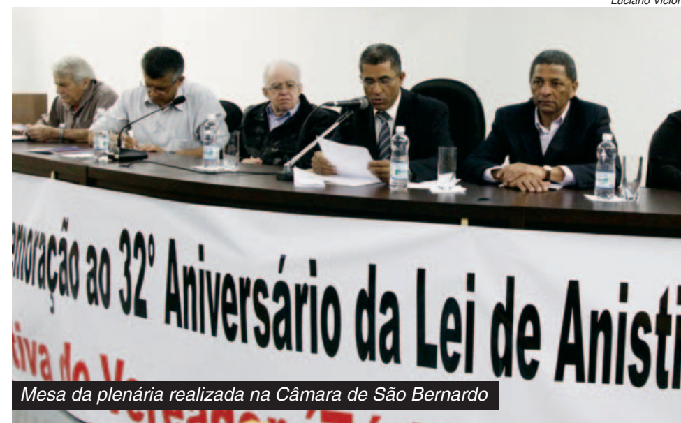
Mesa da plenária realizada na Câmara de São Bernardo

A criação de entidades para levantar as informações daquele período reforça a aprovação do projeto de lei que instala a Comissão da Verdade e que tramita na Câmara