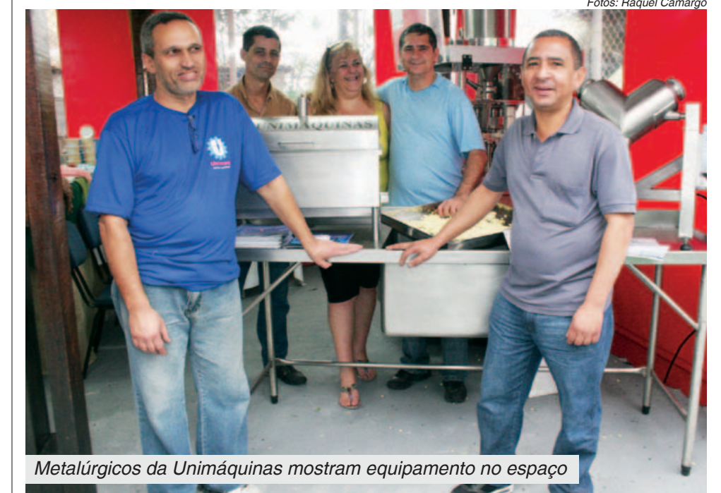
Metalúrgicos da Unimáquinas mostram equipamento no espaço

Apresentar empreendimentos e vender produtos estão entre os objetivos do Espaço Solidário.