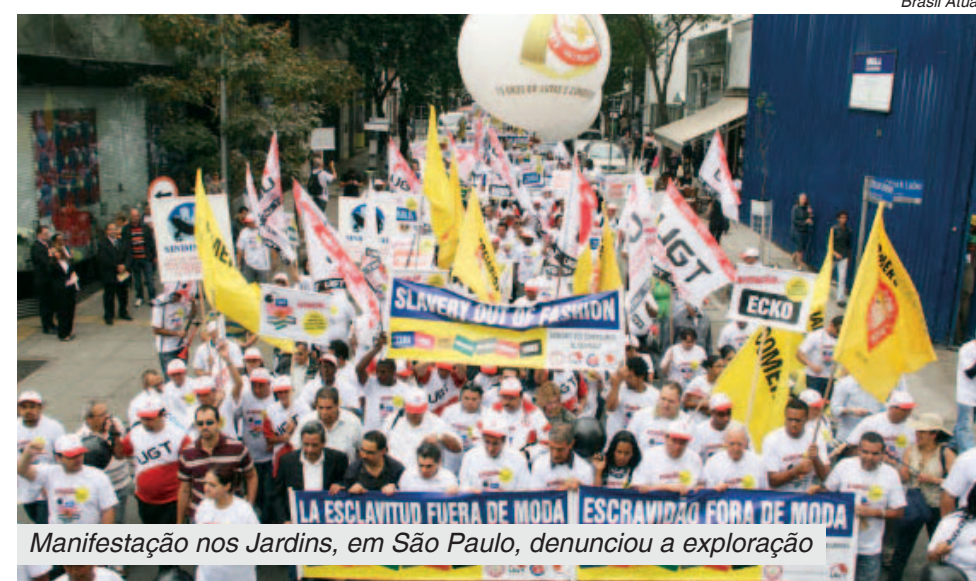
Manifestação nos Jardins, em São Paulo, denunciou a exploração

“As empresas alegam desconhecimento, mas elas sabem em quais condições aconte-