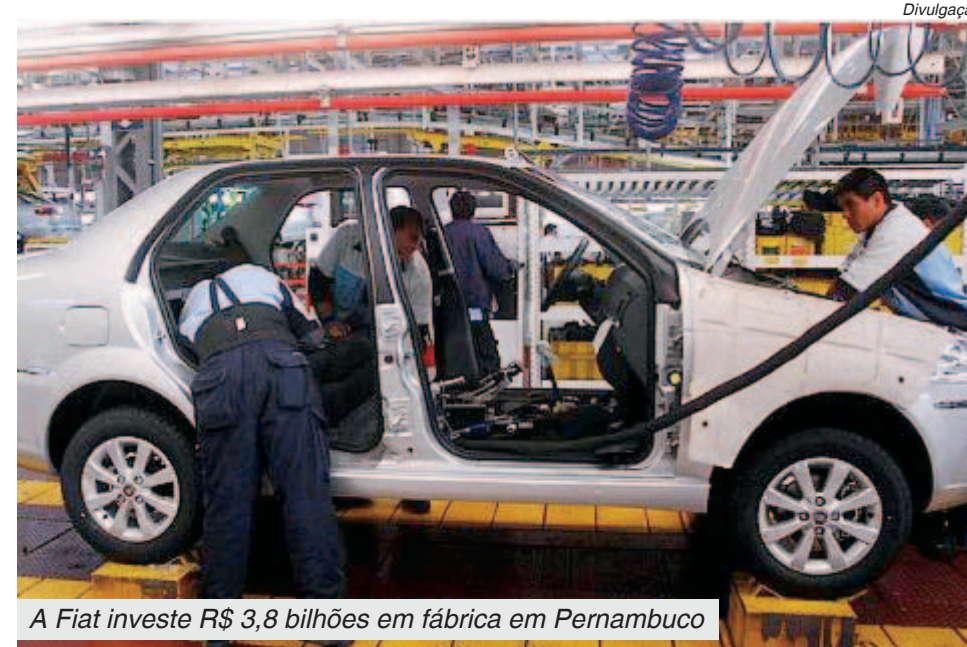
A Fiat investe R$ 3,8 bilhões em fábrica em Pernambuco

A Effa negocia as instalações com os governos de Santa Catarina e Goiás, estados que dão condições especiais para empresas