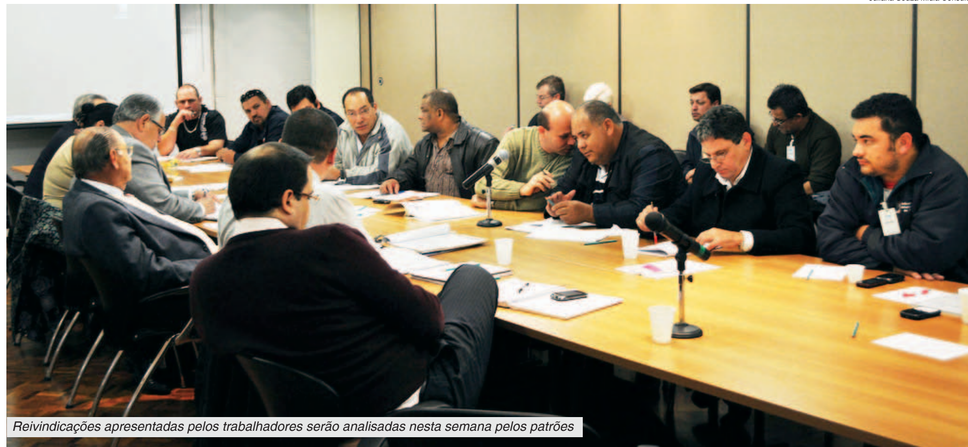
Reivindicações apresentadas pelos trabalhadores serão analisadas nesta semana pelos patrões

Reunião da Juventude Metalúrgica na Volks. Hoje, às 15h30, na Sala da Comissão da Ala 8.