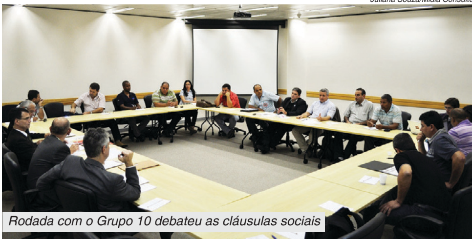
Rodada com o Grupo 10 debateu as cláusulas sociais

Nesta quinta e sexta-feira acontecem as duas primeiras rodadas de negociação com as montadoras na Campanha Salarial. Neste ano, a conversa não será com o Sinfavea, o sindicato das empresas, e sim com as montadoras instaladas em São Bernardo, Taubaté, São Carlos e Tatuí. Ontem, a Federação Estadual dos Metalúrgicos (FEM) da CUT prosseguiu as negociações com o Grupo 3