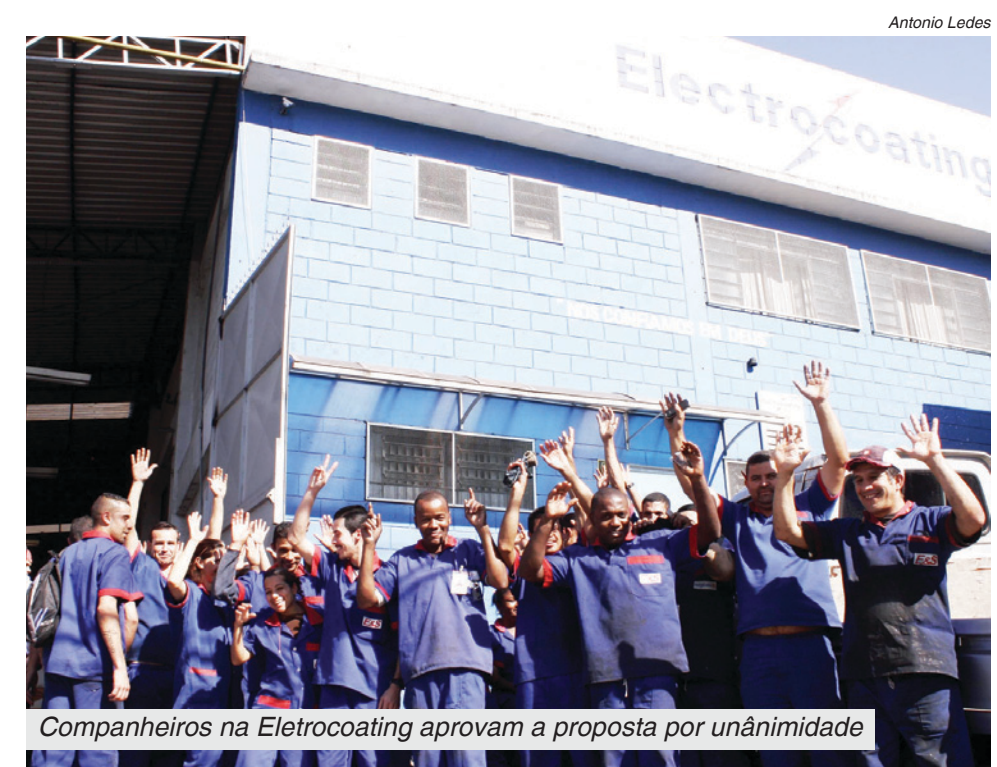
Companheiros na Electrocoating aprovam a proposta por unanimidade

Trabalhadores em mais duas empresas da base aprovaram ontem, em assembleias, propostas de PLR para este ano. Na Fibam , em São Bernardo, cerca