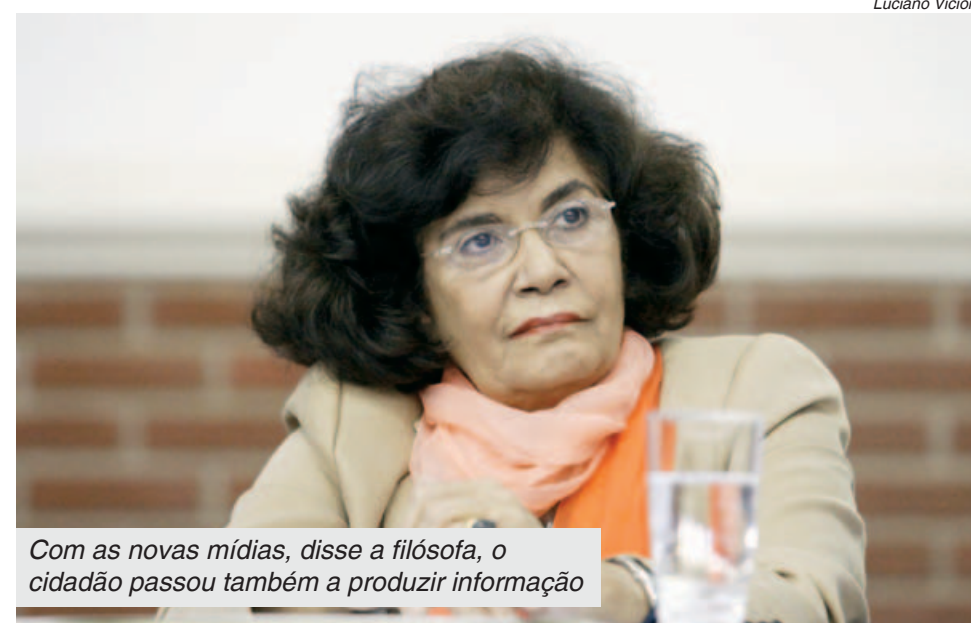
Com as novas mídias, disse a filósofa, o cidadão passou também a produzir informação

Eles operam em dois níveis diferentes. Os produtores da informação, ou aqueles que formam o circuito de circulação da informação, já são pessoas organizadas, e essa é uma informação mais duradoura, ela fortifica os laços de organização. Mas os grandes acontecimentos políticos que vimos agora são de pessoas desconhecidas entre