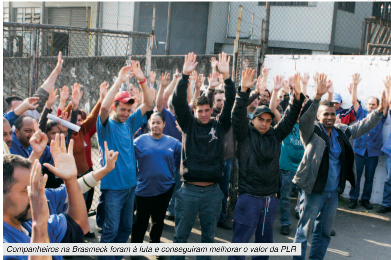
Companheiros na Brasmeck foram à luta e conseguiram melhorar o valor da PLR

A pressão dos trabalhadores na Brasmeck , autopeças em Diadema, garantiu a conquista de um bom acordo de PLR para este ano. A proposta foi aprovada em assembleia no início da manhã de ontem.